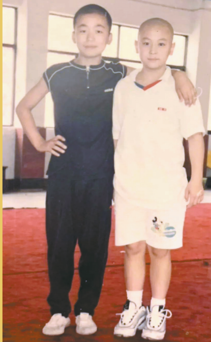
王宝强与释小龙(右)童年合影