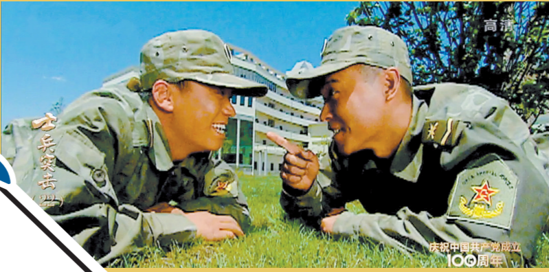
王宝强(左)凭借《士兵突击》火遍全国