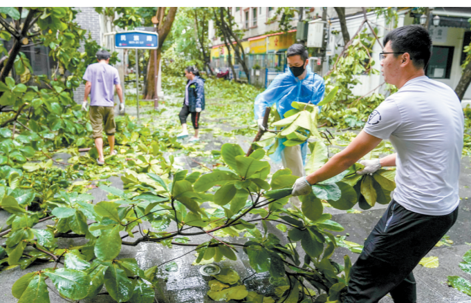
湛江赤坎区民主街道办事处工作人员正在清除路障

供电部门提醒市民群众,风雨天气尽量减少外出,勿在外尤其是在电杆、铁塔、广告牌、大树下逗留;遇到积水处应绕行,远离掉落在地面上的电线;社会用电主体要做好产权所属设备检查,发现隐患请及时排除。