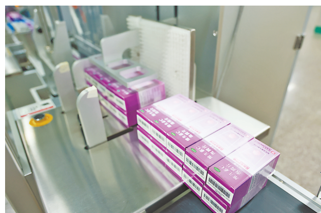
跨境生产的维生素C泡腾片正式在内地投产上市并销售

近期，香港联邦制药有限公司跨境委托其在粤港澳大湾区内地关联公司珠海联邦制药股份有限公司中山分公司生产的维生素C泡腾片正式在内地投产上市并销售，这标志着国家支持港澳药品上市许可持有人在大湾区内地9市生产药品的政策顺利落地实施并取得实效。这对于开创性地推进粤港澳大湾区医药产业融合发展具有重要的示范作用。