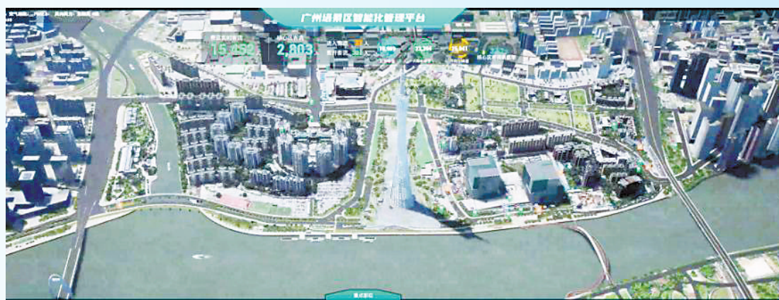
广州塔景区智能化管理平台

海珠区还大胆运用数字孪生技术,把广州塔景区复制到“元宇宙”,打造全市首个智慧城市数字孪生平台——广州塔景区智能化管理平台,建立1972项景区体征指标,对景区内大到地标建筑物,小到城市设施部件,进行全面1:1的3D数字还原。结合人工智能算法引擎的