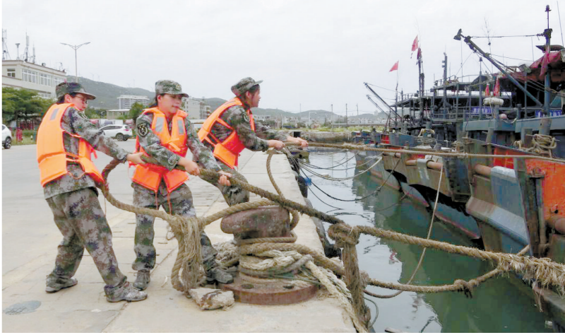
汕头南澳女子民兵对靠岸渔船进行加固