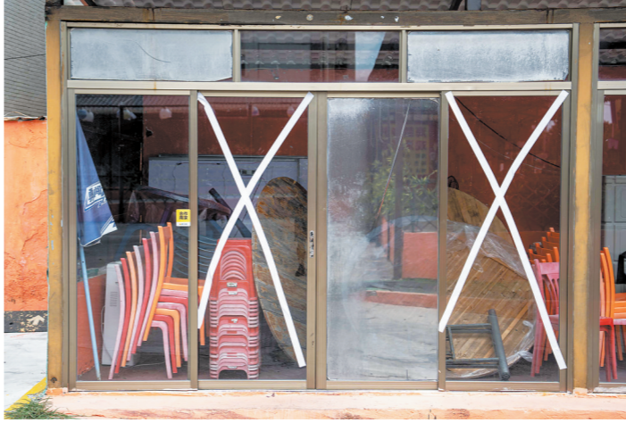
汕头南澳岛居民加固房屋窗户防御台风