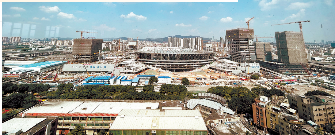
白云站正在建设中

白云站是广州铁路客运枢纽“五主四辅”的主枢纽之一。目前，广州市正在全力建设广州站、广州东站、白云站“三位一体”中心组合枢纽，未来承担中心城区铁路客运主要功能。近日，广州市规划和自然资源局组织交通基础设施规划建设主题调研活动，记者跟随调研团队走进白云站，了解其规划和建设情况。值得关注的是，白云站预计于2023年底具备运营条件，并将结合周边片区共同打造为“广州时尚之都”。