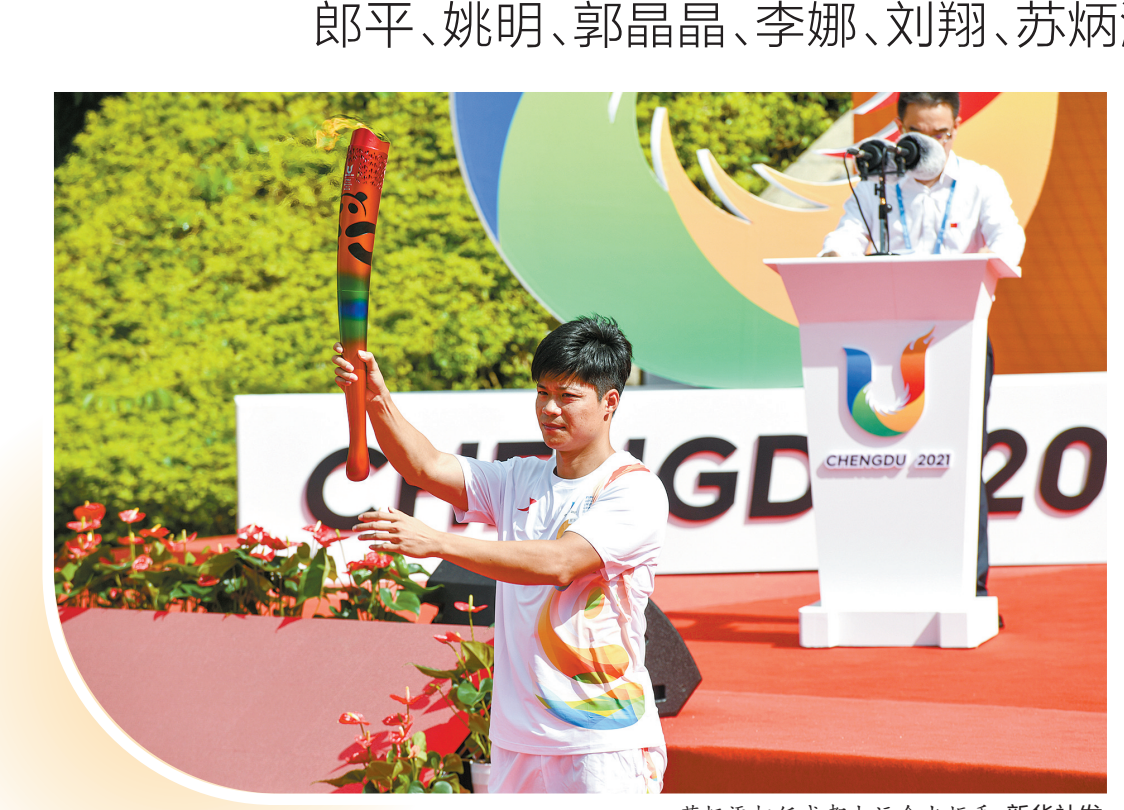
苏炳添担任成都大运会火炬手

第31届世界大学生夏季运动会将于今天在成都开幕。1975年，中国大学生体育协会被接纳为国际大学生体育联合会正式会员。从1977年第九届大运会(即世界大学生夏季运动会，下同)开始，中国代表团从未缺席这个舞台，中国体育一批叱咤体坛的明星运动员在此崭露头角，大运会也因此被称为“中国体育明星的摇篮”。