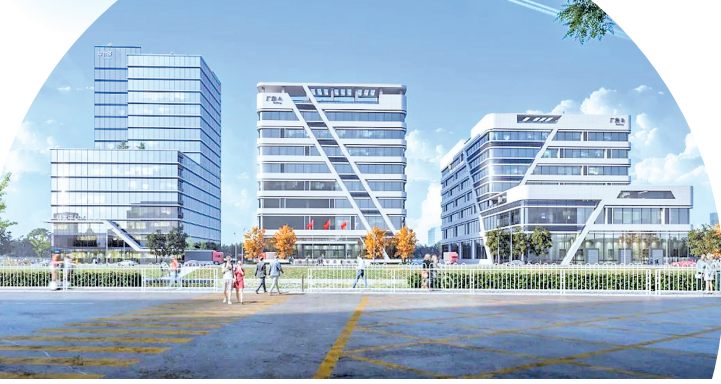
国际智造产业基地项目效果图