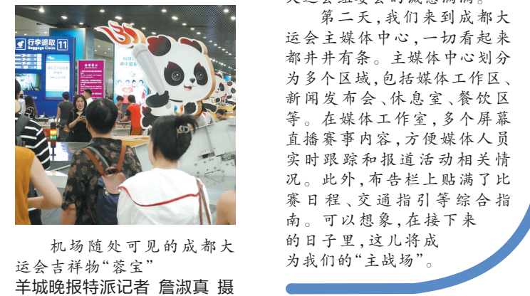
机场随处可见的成都大运会吉祥物“蓉宝”

7月26日，我们从广州白云机场出发前往成都，原计划八点四十分落地双流机场。因为雷雨天气，飞机备降天府机场着陆，一番周折后才再度起飞前往成都，等我们终于落地的时候，已是晚上十一点多。