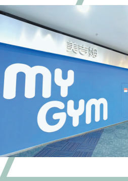
昔日门庭若市,如今空空荡荡