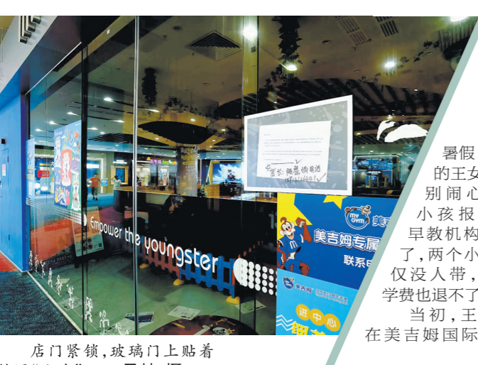
店门紧锁,玻璃门上贴着转课“公告”