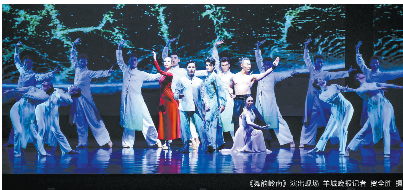
《舞韵岭南》演出现场