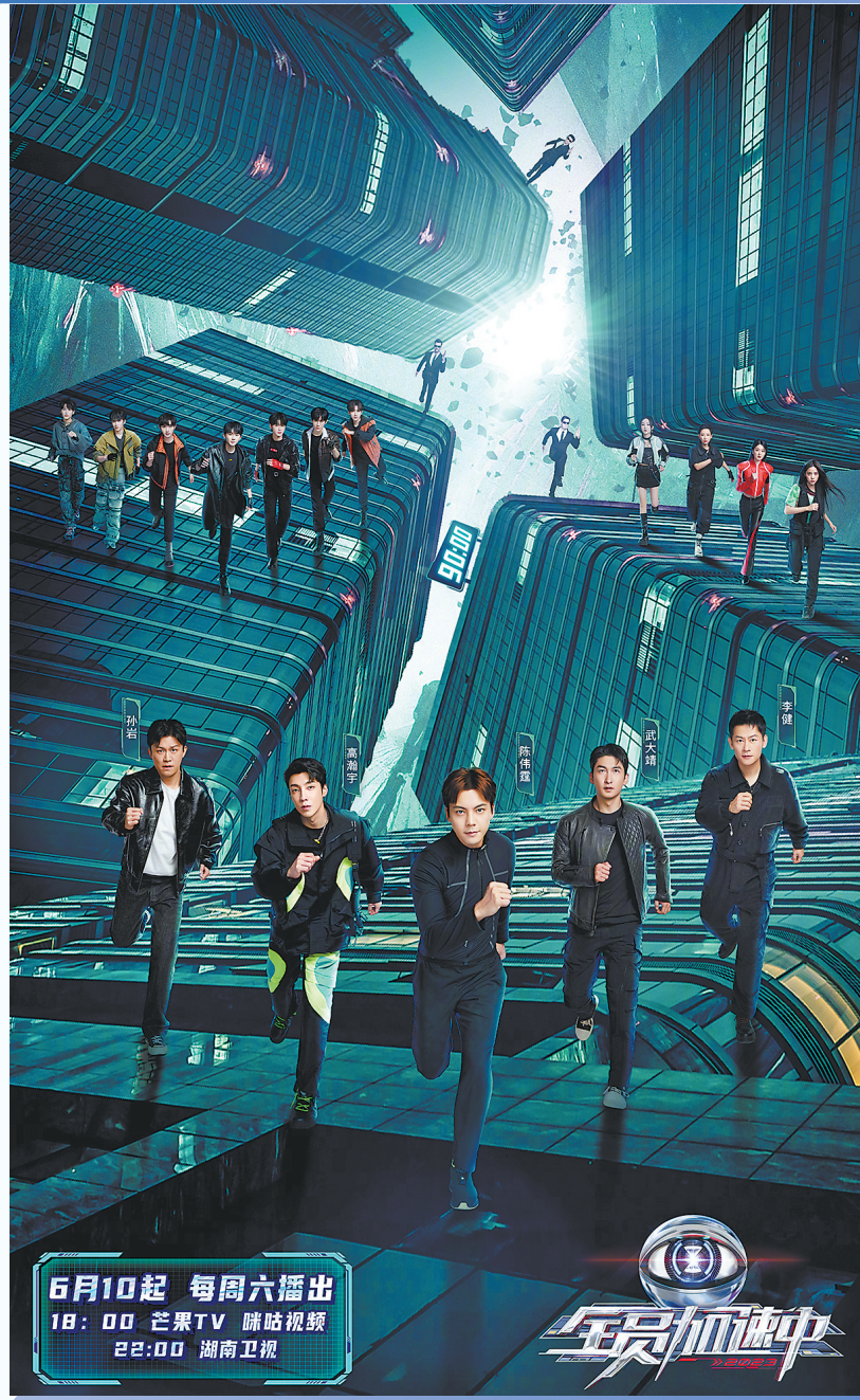
6月10日起 每周六播出 18:00 芒果TV 咪咕视频 22:00 湖南卫视

爱奇艺原创乐队音综《乐队的夏天》，前两季分别于2019年5月和2020年7月在爱奇艺首播。节目让蛰伏多年的乐队通过综艺形式和歌迷互动，让九连真人、新裤子、刺猬、Mr.Miss等小众乐队纷纷“出圈”，首季豆瓣评分8.7分，是少有的爆款小众音综。