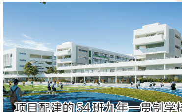
项目配建的54班九年一贯制学校

集团要求摘牌后,3个月内全面开工。项目于今年3月15日全面开工,8月21日18栋塔楼实现全部“正负零”,局部B9栋已完成主体2层,项目计划在10月5日完成主体结构7层建设,达到首个政府回购节点。 在保证安全、质量生产的前提下,该项目将提前完成工程施工节点目标,预计于2025年年初竣工备案并启动整体交付工作,相较于土地出让协议中约定时间提前1.5年。 据悉,中建国际投资·广州白云区龙归陶瓷城安置房项目还将无偿配建一所36班小学。此外,在白云区石门街道黄金围片区还将无偿配建一所54班九年一贯制学校,计划引入广州培英国际学校。