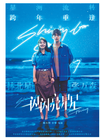
电影《一闪一闪亮星星》海报

同名爆款剧集《一闪一闪亮星星》曾获得很多观众的喜爱，成为2022年开年黑马。时隔一年，电影版在万众期待中开机拍摄，