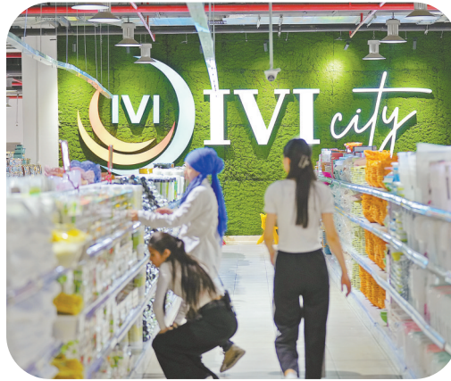
哈萨克斯坦的“中国超市”