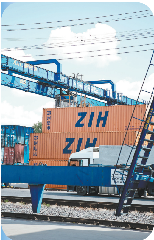
白俄罗斯科里亚季奇 车站中的中国集装箱

今年是“一带一路”倡议提出十周年。被称为“钢铁驼队”的中欧班列，连接起了中国与中亚、欧洲的广袤市场。日前，羊城晚报记者循着中欧班列的足迹一路向西，探访哈萨克斯坦、白俄罗斯、德国等重要站点，记录中欧班列开行带来的发展红利与光明前景，尝试解读中欧班列“车轮”为何越转越快，“粤”来越好。