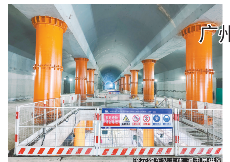
流花路车站主体

主要障碍。越秀公园这座“天然历史博物馆”,是非物质文化遗产项目的重要传承传播阵地。越秀公园确权登记将获得更完善的物权保护,有利于进一步保护生态环境和景观资源,提升管理效率和运营能力。