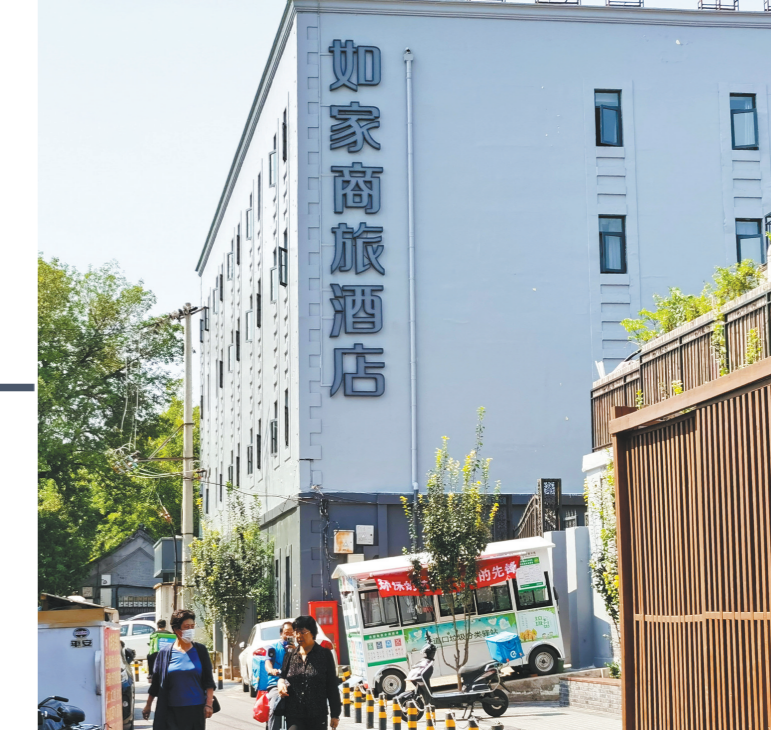
酒店业绩强力复苏

为何突然涨价“凶猛”? 暑期出游需求高涨或成为酒店涨价重要原因。中国国家铁路集团有限公司数据显示,7月1日至8月31日,全国铁路累计发送旅客8.3亿人次,创暑运旅客发送量历史新高,单日旅客发送量最高达1569万人次;民航局统计数据显示,7月完成旅客运输量6242.8万人次,较2019年同期增长5.3%,创民航月度历史新高。记者注意到,华住集团在财报中强调,由于上半年业绩表现良好,提高了2023年的业绩预期,预计全年收入同比增长在48%到52%之间,相较于此前42%到46%的预期有所提升,并预计今年将开业1400家酒店。艾媒咨询CEO兼首席分析师张毅在接受记者采访时表示,暑期档酒店价格普遍“狂飙”的现象只是偶然,不会是持续性的行业现象。“理性消费在国内的文旅市场还是主流。价格上涨相应的,消费者就会对服务体验、住宿品质有更高的要求,与价格相匹配的要求,这种迫切会导致行业内出现新的竞争者。”张毅说。华住集团也表示,已经高度关注到部分热门地段酒店价格过高的情况,将关注旅游旺季的价格管理,确保明码标价、规范经营,并为消费者提供更多选择。