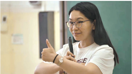
吸顶式教学智能安全音响系统为老师嗓子减负