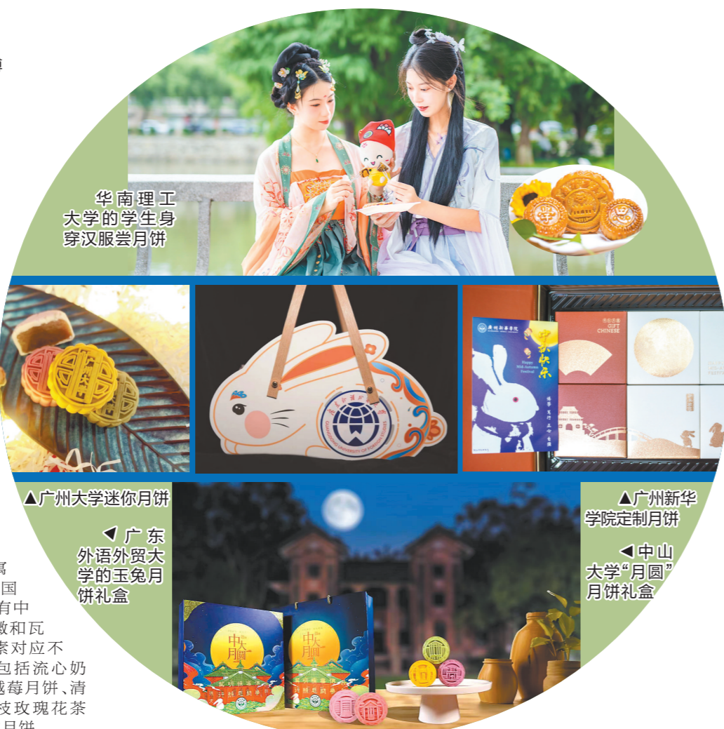
▲华南理工大学的学生身穿汉服赏月

华工将华园特有的元素与中秋月饼结合，除校徽、校训等常规设计外，还印有百步梯、湖心亭、牌坊、校训石等校园地标，包括华园校训月饼、华园景观月饼、广式流心月饼。除了传统月饼，今年华工面包房还新推出雪媚娘流