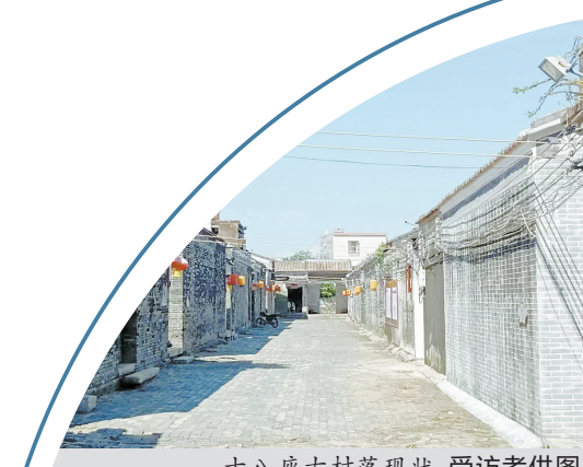
十八座古村落现状 受访者供图

雅韶十八座的传统民居建筑展现出典型的粤西沿海民居特色，其建筑用材讲究，墙体全为青砖酥灰，建筑构件木雕精美、工艺精湛，是研究粤西沿海地区传统建筑，特别是清代传统民居建筑的重要标本。村中民风淳朴，生活生产基本保持原生态，保留了浓郁的传统文化。地方政府重视古村落传统文化，保护和弘扬古民俗风情，展现出浓郁的清代古寨历史风貌和传统农业社会生产生活文化。