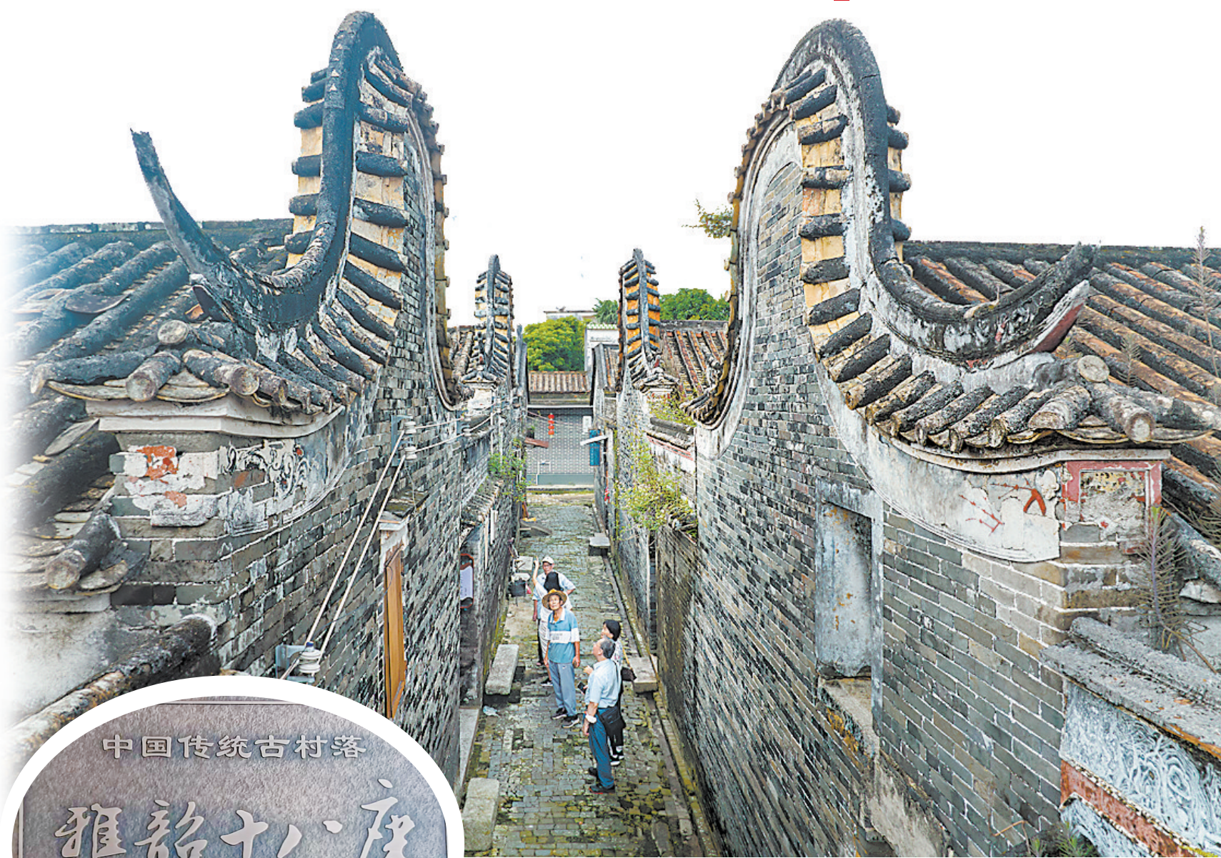
中国传统古村落 雅韶十八座 始建于清乾隆二十二年（公元1757年）

在明清时期的岭南民居中，一般是出过高官的村落，才有资格在屋顶竖起镬耳山墙。十八座中原有大量的镬耳山墙，但大部分被拆毁。