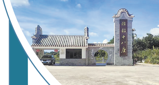
十八座古村落一角