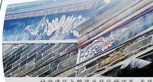
村中建筑上雕刻画栋依稀可见，龙凤朝阳的浮雕仍有残留