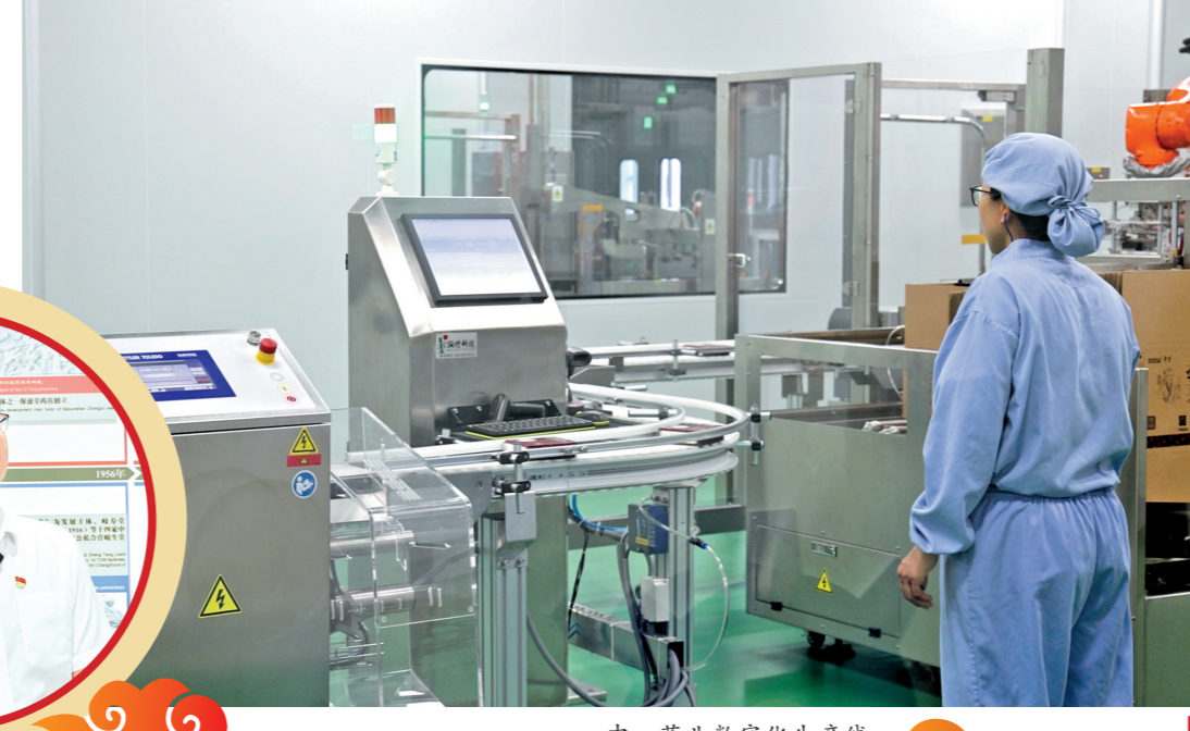
中一药业数字化生产线