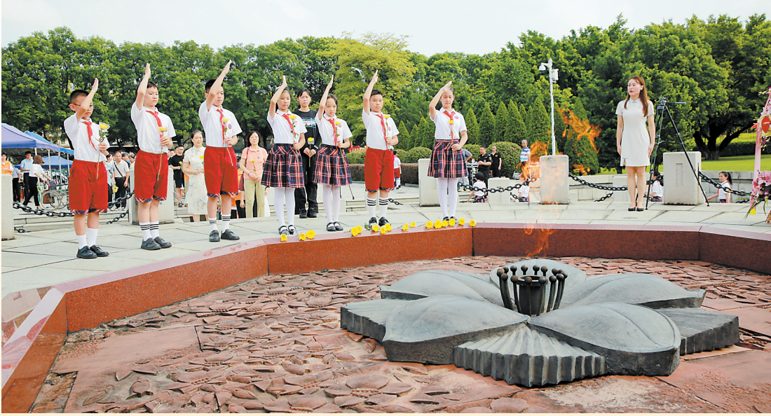
广州市银河烈士陵园广场,少先队员行队礼致哀思

羊城晚报讯 9月30日,广州市银河烈士陵园在广场举行烈士纪念日敬献花篮仪式。上午10时,陵园广场庄严肃穆。礼兵就位,奏唱中华人民共和国国歌,全场肃立,向烈士默哀。银河小学20名少先队员献唱《我们是共产主义接班人》,高举右手,齐行队礼,表达对烈士的哀思和对祖国的热爱。伴随着深情的《献花曲》,12名礼兵护送着6个花篮,缓步走向地坛,将花篮整齐地摆放在象征革命精神的长明火炬旁。参加仪式的单位负责同志和烈属代表上前双手仔细整理缎带。参加人员向象征着烈士精神的长明火炬敬献花篮。