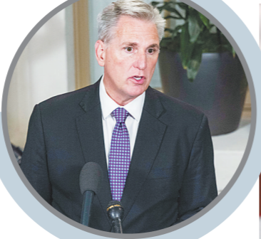
▲9月29日在美国华盛顿国会山拍摄的共和党籍众议长麦卡锡 ►众议院投票罢免麦卡锡

在美国国会历史上,此前还没有众议院议长被罢免过。《国会山报》文章指出,麦卡锡“历