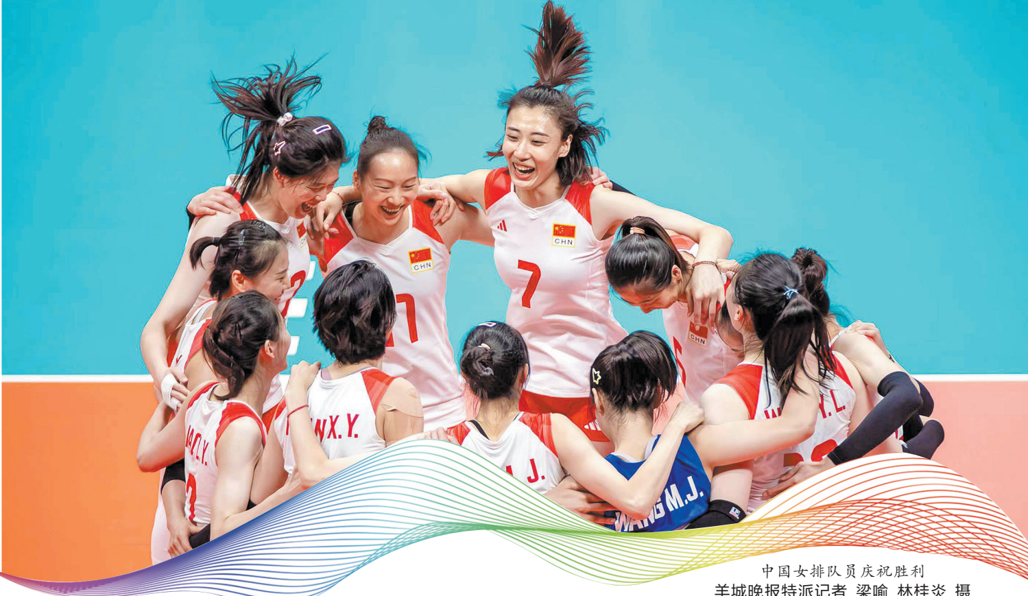
中国女排队员庆祝胜利