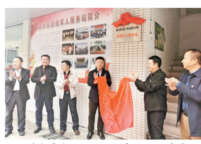
全国首个跨省退役军人服务站2020年成立

在广州市花都区新华街红珠路11号，一块挂在墙上的“湖南省新田县驻广州市花都区新华街退役军人服务站”牌子格外醒目。这里是全国首个跨省建立的退役军人服务站。据了解，该服务站成立以来，粤湘两地打破区域限制和行政壁垒，实现就近能办、异地可办的退役军人服务新模式，引导退役军人为广东经济社会发展作出应有的贡献。