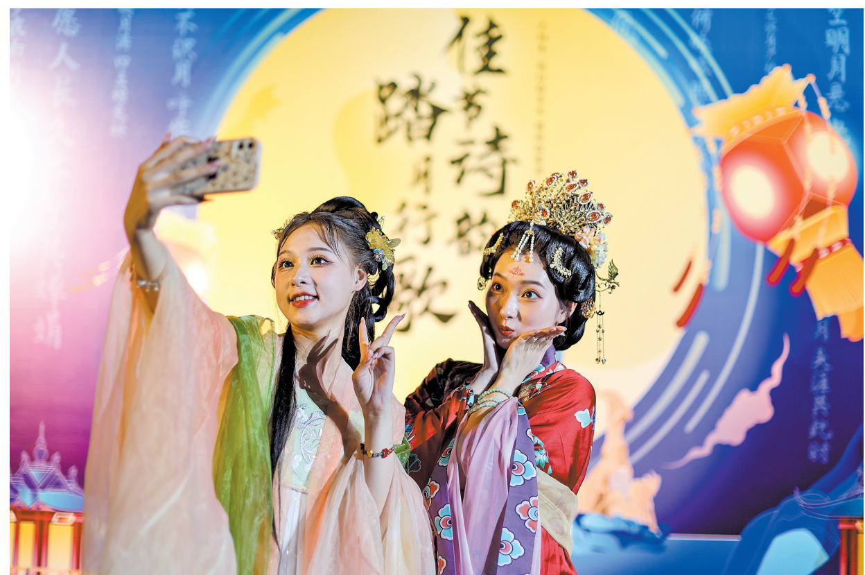
羊城晚报记者 李春炜 通讯员 詹莘莘