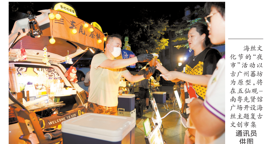
海丝文化节的“夜市”活动以古广州蕃坊为原型，将在五仙观-南粤先贤馆广场开设海丝文创市集

宋朝的广州，得益于古代海上丝绸之路带来的商机，来自外国的人们络绎不绝，夜市蓬勃兴旺。记者了解到，