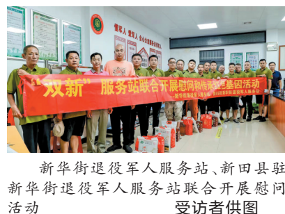
新华街退役军人服务站、新田县驻新华街退役军人服务站联合开展慰问活动

退役军人花名册、志愿服务建设方案、困难退役军人帮扶救助台账……走进服务站，档案柜中数百个文件夹记录着在花都区就业创业的新田籍退役军人的详细资料。