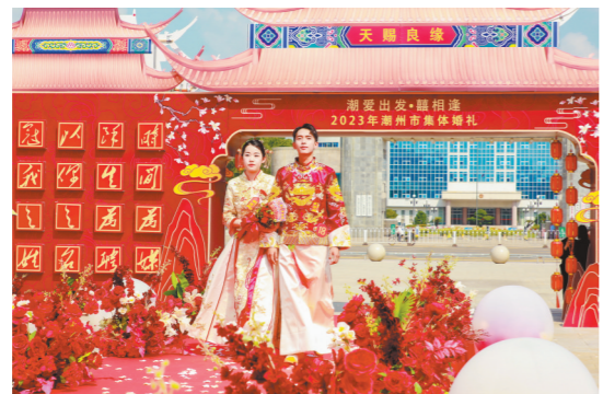
新人手捧“喜相逢”刮刮乐花束

记者从潮州市福彩中心获悉，近日，“潮爱出发·喜相逢”潮州婚俗文化公益集体婚礼在潮州市人民广场举行。在千年古城和公益福彩的见证下，15对新人携手开启幸福美好生活。