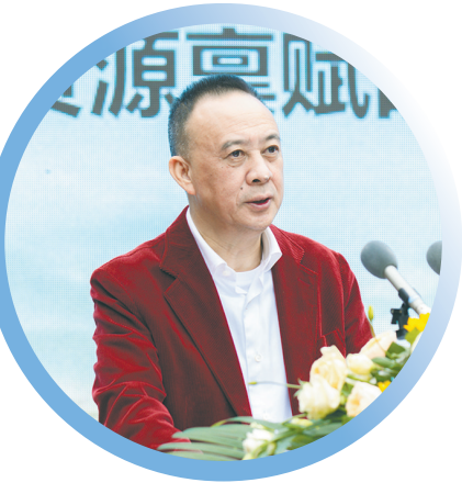
郎酒集团董事长汪俊林