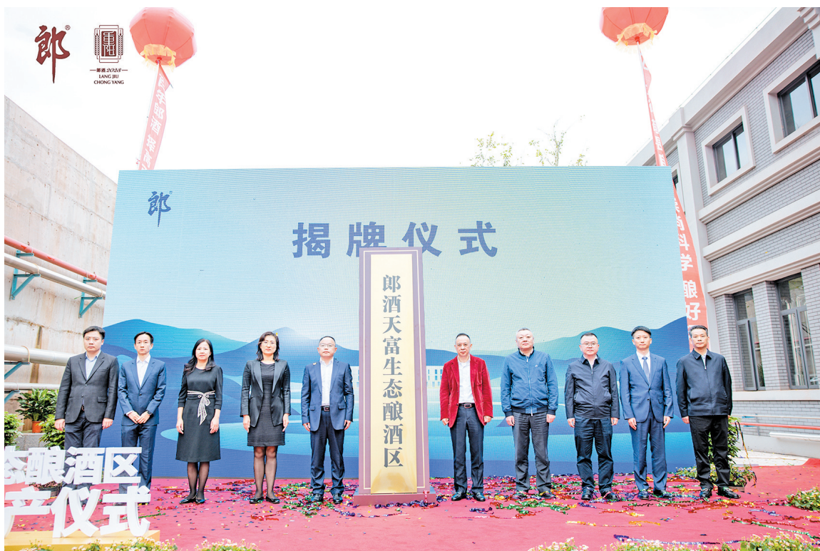
郎酒天富生态酿酒区揭牌投产

历史发展规律反复证明，大家好才是真的好。同时，汪俊林提出郎酒将和习酒等赤水河左岸、上下游的众多兄弟企业融合发展，各美其美，美美与共，共建赤水河中国酱香酒谷，为消费者提供更多选择。