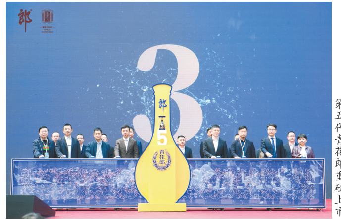
第五代青花郎重磅上市