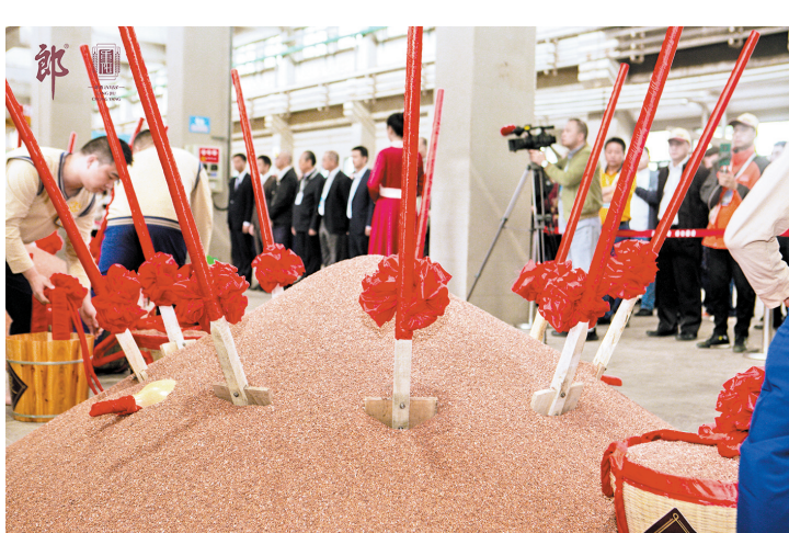
下沙环节正式开始