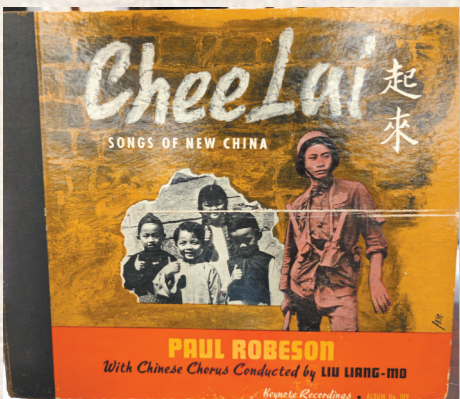
美国歌手保罗·罗伯逊用中英文演唱《义勇军进行曲》等中国抗战歌曲的黑胶唱片《起来 Chee Lai》