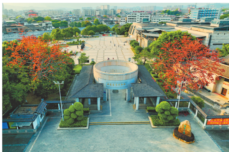
位于广东梅州的客家博物馆,全面展示着客家民系文化渊源与发展

第六届世界客商大会正式拉开帷幕。11月2日,大会一系列预热活动展开,海内外客商陆续抵达梅州。在3日上午举行的大会开幕式上,福建、江西、广东三省苏区振兴发展投资推介和全球客商支持广东“百千万工程”启动仪式将一并举行。届时,全球客商将齐聚一堂,展开深入交流。