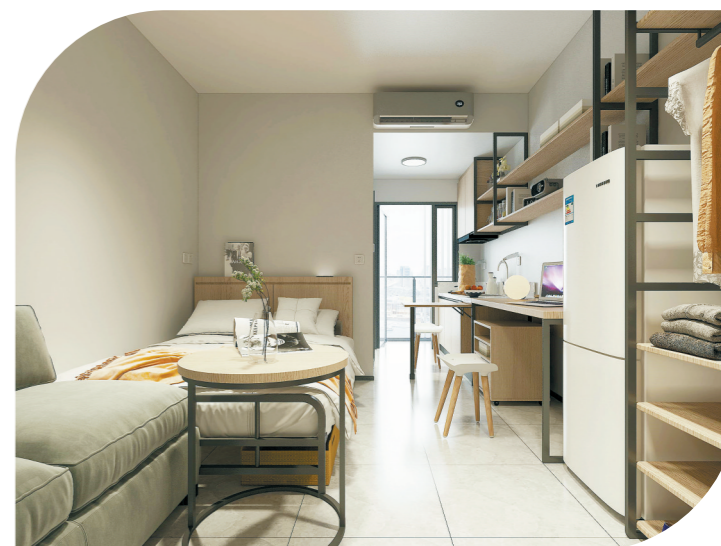
可移动周转型保障性租赁住房效果图

该方案由深圳市中集建筑设计院有限公司、深圳市龙华人才安居有限公司、深圳市建设科技促进中心联合研究,旨在发挥可移动钢结构模块化建筑易建、绿色、环保等优势,利用零散闲置用地提供周转型保障性租赁住房(以下简称“保租房”),解决新市民、年轻人的住房困难,托起他们的安居梦。