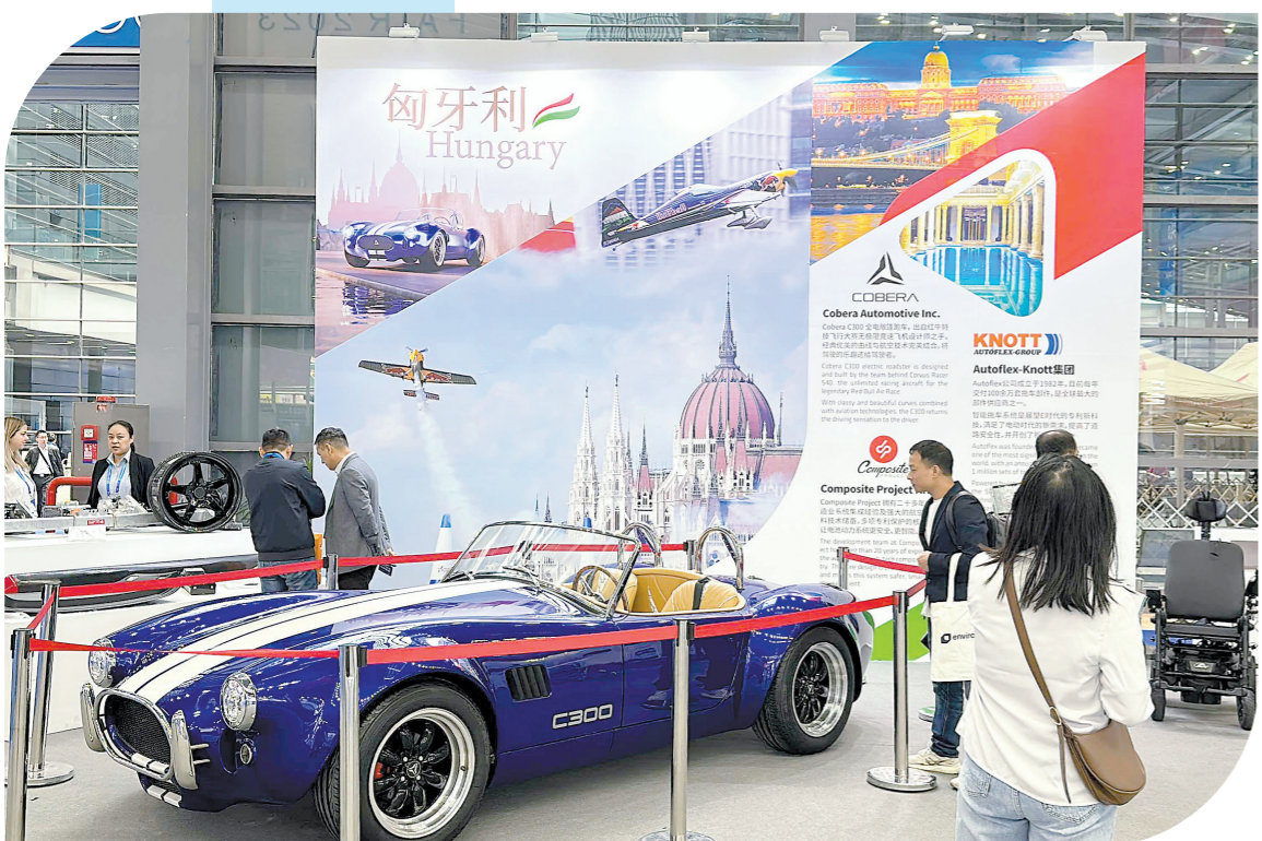
匈牙利展位展示的一款全电动敞篷跑车

据悉,短短两年时间,中集集团已为香港打造了6个过渡性住房项目,项目总计提供近3600套住房,预计惠及逾15000名基层市民。