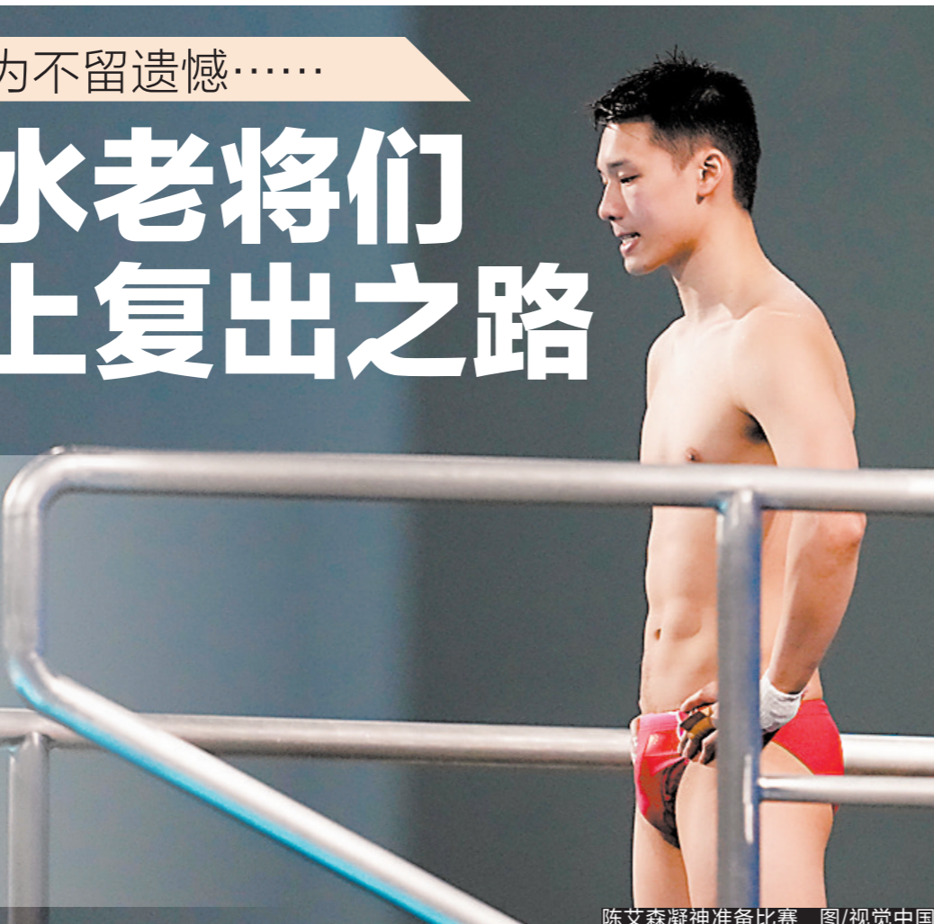
陈艾森凝神准备比赛

2023年全国跳水锦标赛暨巴黎奥运会、多哈世锦赛选拔赛正在武汉体育中心如火如荼地进行中,此次赛事将是继杭州亚运会后,全国优秀跳水运动员的首次集体亮相。跳水健儿们争夺全国冠军的同时,还要全力争取代表国家队征战多哈世锦赛和巴黎奥运会资格。