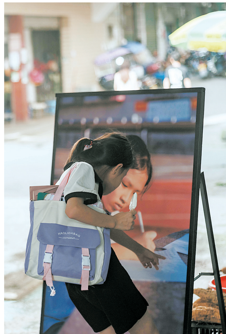
翁城小诗人在观看自己的肖像