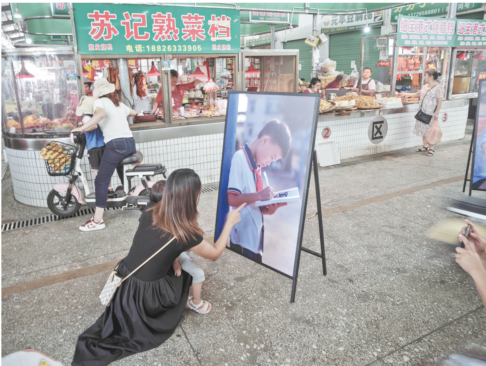
摄影师阳琰的“翁城小诗人”摄影展在翁城镇肉菜市场展出，路过的家长在教育自己的小孩

翁城诗歌的故事还会继续，相信会有更多的人愿意为诗歌驻足停留，也相信诗歌会带着翁城小镇和那里的孩子们走向更美丽的远方。