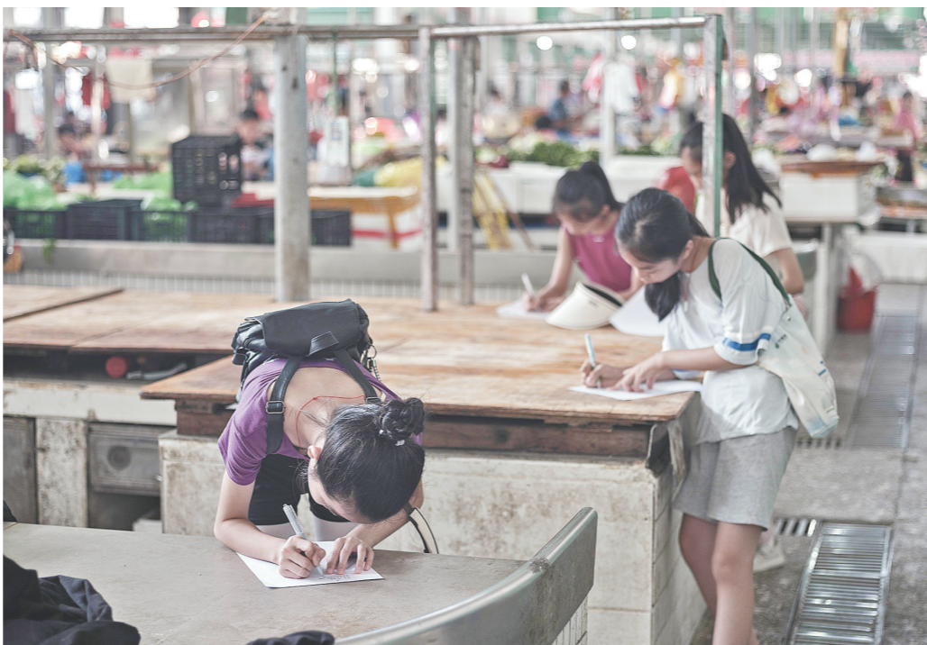
孩子们在菜市场现场写诗