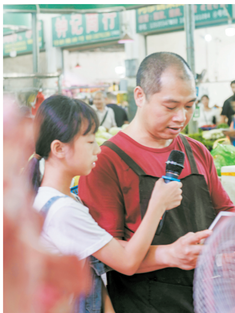
孩子们和肉菜市场摊主一起朗读《翁城孩子的诗》