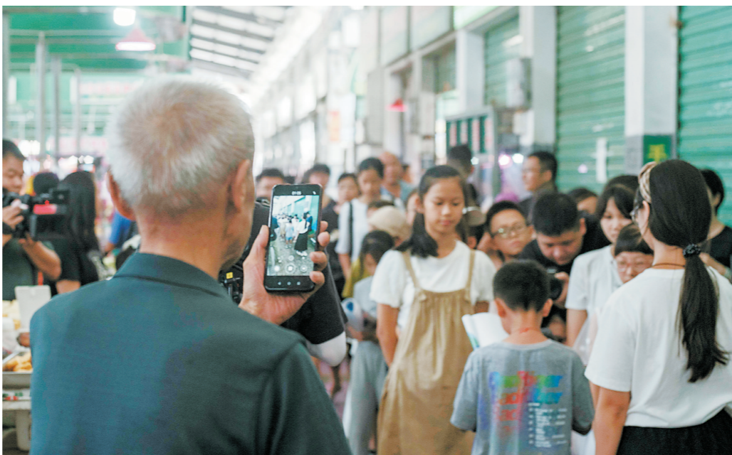
路过的老人在用手机拍摄孩子们读诗