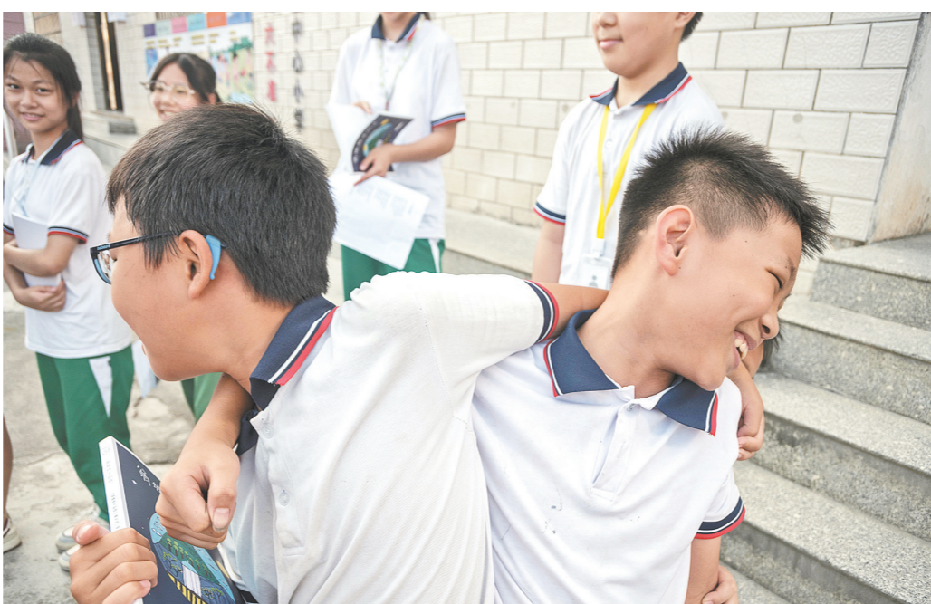
孩子们原本也是诗歌的一部分