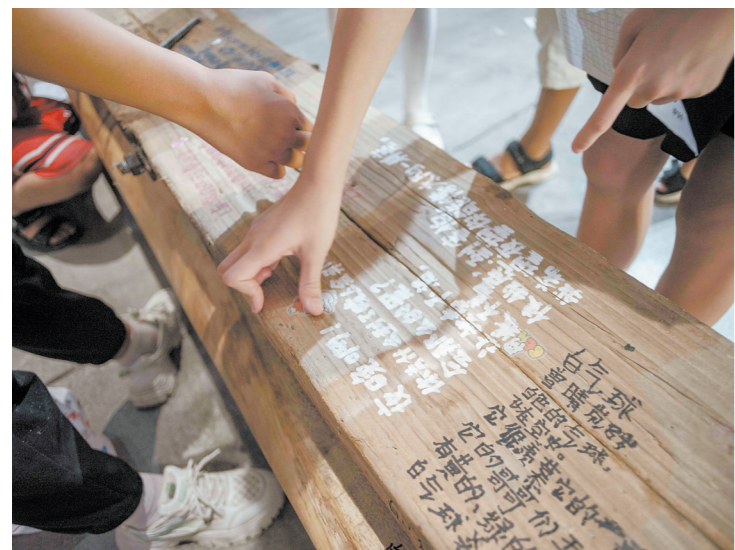
艺术装置中孩子们写的诗