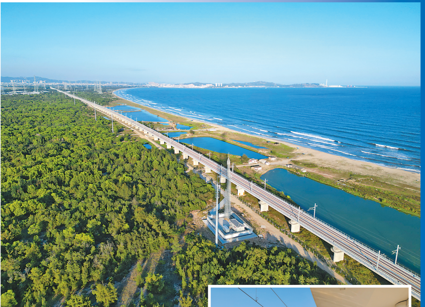
11月25日，汕汕高铁汕尾至汕头南段正式进入试运行阶段 汕汕高铁全线共设7座车站

汕汕高铁将与广汕高铁、漳汕高铁、福厦漳高铁、温福高铁、甬台温高铁共同构成国家东南沿海高铁通道的甬广高铁，途经广东、福建、浙江三省15个城市，是连接珠三角城市群和长三角城市群的重要纽带。开通运营后将进一步完善国家“八纵八横”高速铁路网主通道之一的沿海通道路网结构，为沿线城市融入湾区、连接华东提供了重要通道，对促进地区高质量发展，方便群众出行、优化营商环境、推动产业发展，助力乡村振兴，具有十分重要的意义。