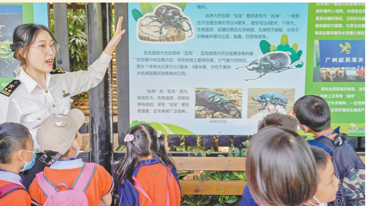
番禺海关新时代文明实践特色基地

的新模式为“百千万工程”注入新活力，推动结对共建出新出彩”。基地办公室主任钱军表示，下一步，番禺海关将充分利用好新时代文明实践特色基地，着重发挥在国门生物安全、文明出入境、海关政策解读等方面的优势。