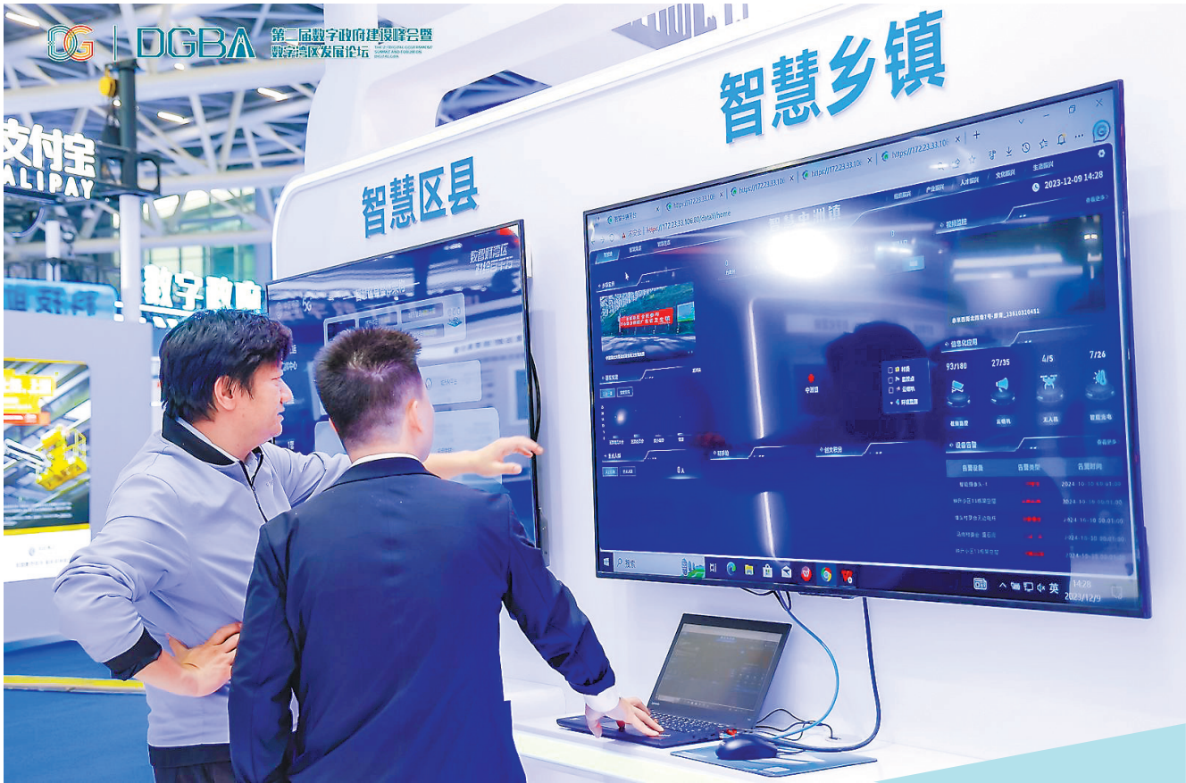
第二届数字政府建设暨数字湾区发展成果博览会现场展示的智慧服务案例

近年来，粤港澳大湾区建设加速推进。广东省政府印发的《“数字湾区”建设三年行动方案》明确表示，“数字湾区”建设总目标是将粤港澳大湾区打造成全球数字化水平最高的湾区，并重点提及要打造公共服务融合便利“生活通”，实现更多居民和企业高频事项“跨境通办”。“湾事通”作为落实行动方案的首批成果之一，进一步便利了大湾区居民生活。