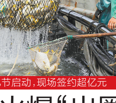
湛江渔民捕正火热进行,金鲳鱼丰收丰收