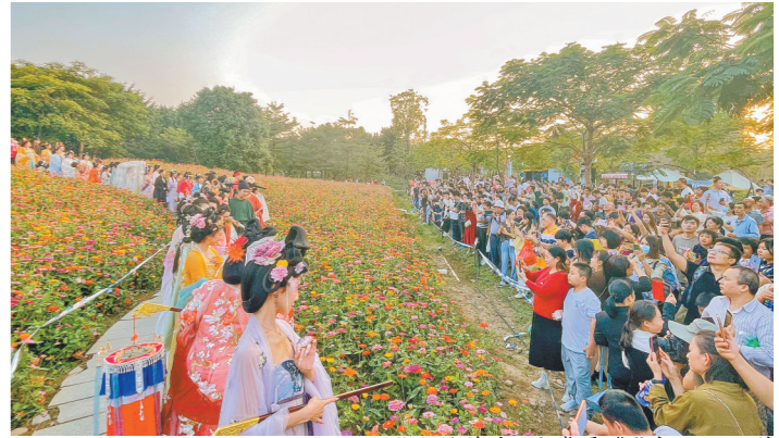
“秋韵菊城 共赏霓裳”中山汉服节

羊城晚报讯 记者张德钢、通讯员赖摄影报道:12月11日,2023年中山小榄菊花会落下帷幕。在过去半个多月的时间里,“菊城小榄”以盛迎八方游客。数据显示,2023年小榄菊花会从11月23日开园,共吸引市民游客超75万人次。