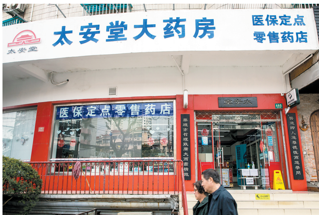
太安堂旗下药房

此前,由于上述资金占用事项未能在规定日期内完成清偿,太安堂被实施特别警示处理,2022年9月26日公司被深交所“ST”,截至2022年年底,*ST太安控股股东非经营性资金占用上升为4.57亿元,且目前清欠几乎无进展。2023年5月5日,太安堂股票由ST太安变更为*ST太安。