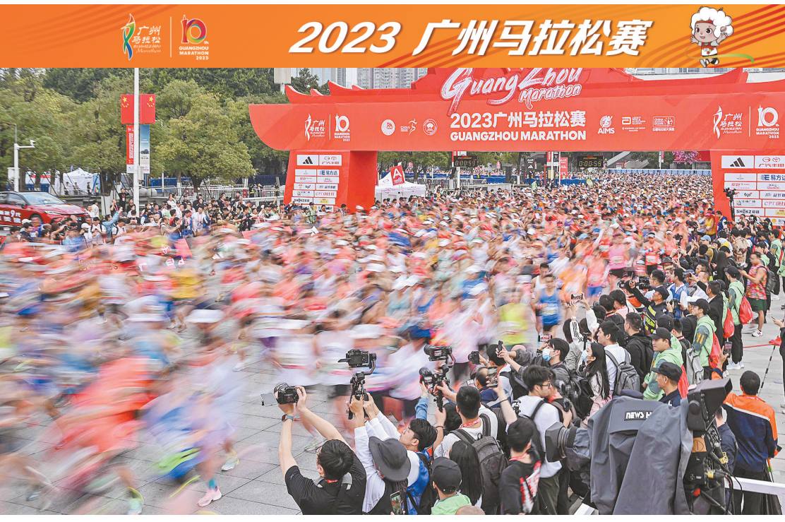
广马赛况

筹备一场马拉松赛事,广东省田径协会组织专家组去现场实地勘察,尤其是起终点的流线、赛道