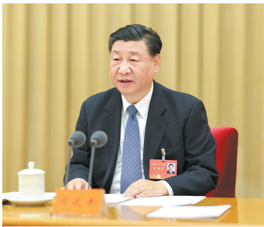
12月11日至12日，中央经济工作会议在北京举行。中共中央总书记、国家主席、中央军委主席习近平出席会议并发表重要讲话

会议强调，做好明年经济工作，要以习近平新时代中国特色社会主义思想为指导，全面贯彻党的二十大精神