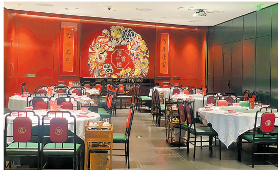
位于广州黄埔的莲香楼至泰广场店，由广州百莲餐饮服务有限公司（广州枫盛投资有限公司投资）经营