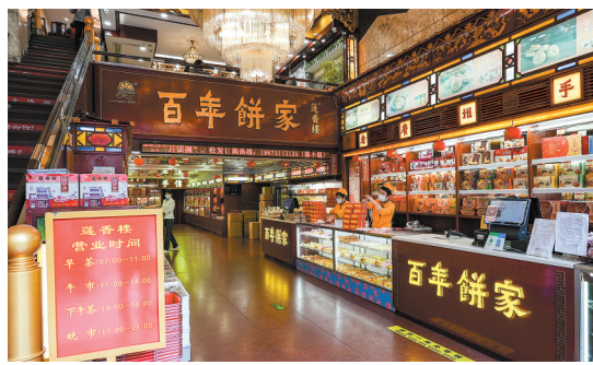
位于广州荔湾的莲香楼老店，由广州莲香楼有限公司经营

表示，一旦签署商标属“普通授权”文件，公司在法律上会有“认可商标使用性质”的风险，不利于下一步维权。该律师同时指出，商标许可性质需要双方通过合同厘清，但中华老字号资格复核文件只是商标许可证明。因此，莲香楼公司呼吁相关方先给予本年度的商标许可文件，携手保住中华老字号的荣誉。