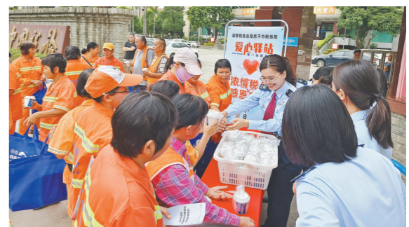
国家税务总局恩平市税务局在“税务爱心驿站”开展“浓情税月 感恩有你”送温暖活动

税务爱心驿站、税务书屋、恩州税费服务驿站……今年以来，一个个“税”字号文明实践阵地陆续亮相，开启了恩平市新时代文明实践建设的新篇章。 自今年8月建立新时代文明实践点以来，国家税务总局恩平市税务局（以下简称“恩平市税务局”）致力于丰富文明实践内涵，提升文明实践效益，推动精神文明建设高质量发展。据悉，这是恩平市首个建立新时代文明实践阵地的行政机关单位。