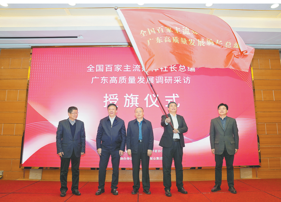
授旗仪式

具体来看,在规则衔接和要素流通方面,将加快共建“数字湾区”,推进跨境政务服务互联互通,及金融领域、社保等领域的规则、制度衔接,扩大职业资格互认范围。