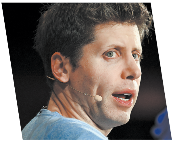
经历了“宫斗”的奥特曼又回归 OpenAI 重新担任首席执行官

11月17日，全球最知名人工智能初创公司、开发了生成式AI(人工智能)“Chat GPT”的OpenAI CEO 山姆·奥特曼突然被董事会解雇，震动了全世界的人工智能行业。随后，历经5天，被罢免的奥特曼又很快被复职，这场“硅谷内斗”被视作人工智能初创公司的“灵魂之战”。 12月中旬，OpenAI 发布公告：董事会现在有权否决CEO奥特曼的决定。特别是针对GPT-5等前沿模型安全风险是否过高，是否对外发布等关键问题。 12月底，奥特曼给2023打上了一个新标签——“世界开始认真对待人工智能的一年”，并将他的思考总结为17条经验，起了个标题叫《希望有人早点告诉我这些》。其中一条是“对团队来说，完成一件真正重要的难事比做一件无关紧要的易事更容易；大胆的想法能够激发斗志。”对此，OpenAI 总裁 Greg Brockman 评论称：“很违背直觉但又很真实。”