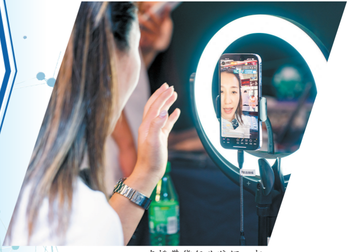
直播带资行业狼烟四起

今年8月初，盒马X会员店在北京、上海推出“移山价”的活动，在山姆会员店售价为128元的1000g 装榴莲千层，同款在盒马APP的X会员区只需要99元。作为“网红爆