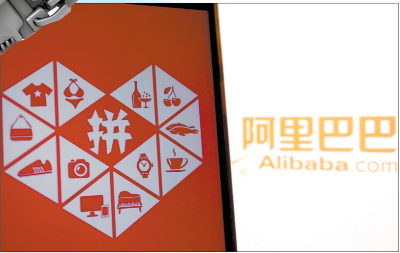
拼多多市值一度超过阿里巴巴，引发关注

值得一提的是，对于电商企业的市值多寡应该理性看待。早在今年3月，阿里巴巴就宣布要启动“1+6+N”组织变革，阿里巴巴被彻底拆分，并宣布阿里云将于未来12个月内从阿里集团完全分拆独立走向上市，菜鸟、盒马也将启动上市计划。不过，阿里在最新的财报中披露，鉴于多方面不确定性因素，不再推进云智能集团的完全分拆。与此同时，盒马的首次公开募股计划已暂停。