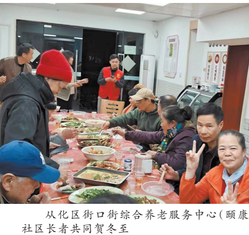
从化区街口街综合养老服务中心（颐康中心）邀请逸泉社区长者共同冬至