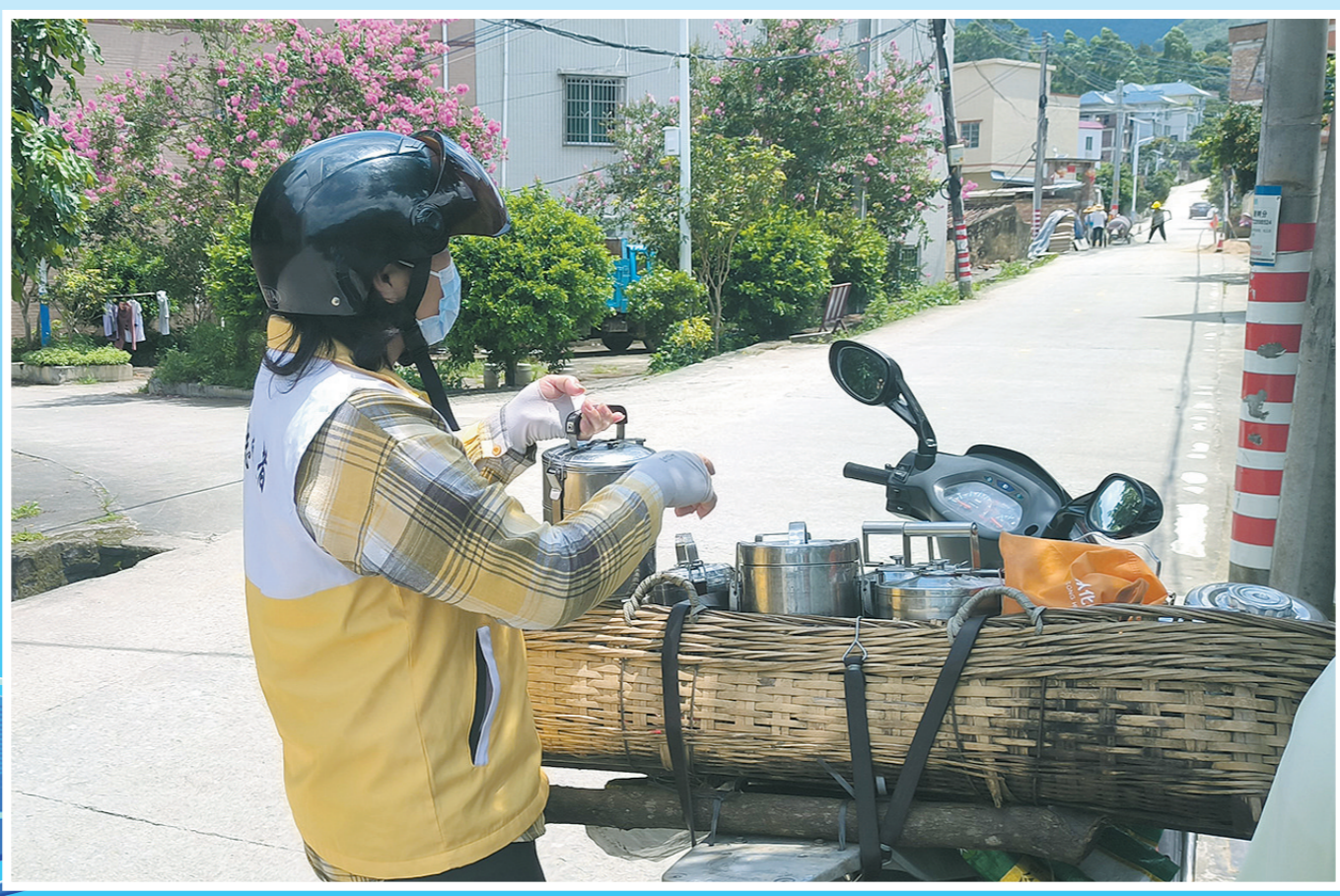
志愿者为从化区江埔街凤二村的老人送餐上门

从春至冬，广州的民政工作者一直奔走在村头巷尾。 回望2023，广州养老服务再次获国务院督查激励，“善”暖社区慈善项目获全国表彰并在人民大会堂作代表发言；全国婚俗改革实验区、全国村级议事协商试点、全国“深化乡村地名服务 点亮美好家园”等一批国家试点、示范点工作成效显著…… 每一项工作，都出自民政工作者的“铁脚板”。在广州市从化区凤二村，志愿者和社工化身长者饭堂的“配送员”；在南沙区东涌镇，“地名上图”让大排档店主感叹生意更好了；在白云区寮采村，村民们在指尖、在祠堂商议大小村务；在清远市连南三排镇，村里老少都记着广州的帮扶…… 推进实施“百千万工程”，最艰巨最繁重的任务依然在农村。当每个村的短板逐渐加长，就能为高质量发展注入新动能。 开局即冲刺。2023年，广州市民政局深入贯彻省委、市委关于推进“百千万工程”的部署要求，以加强民生保障为抓手，通过织牢民生兜底保障网，提升民生服务水平、完善基层治理模式、加大多元帮扶力度，全力推动“百千万工程”在民政领域落地见效。