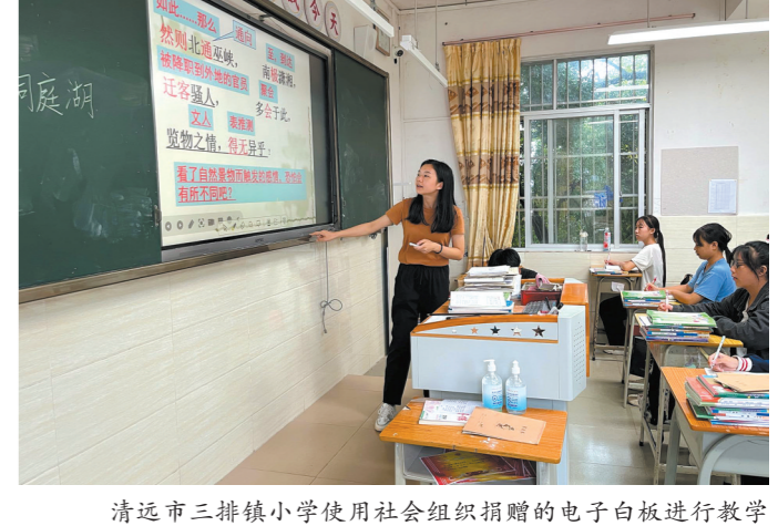
清远市三排镇小学使用社会组织捐赠的电子白板进行教学