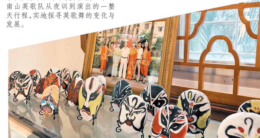
南山小学孩子们的英歌舞脸谱石头画

2023年12月18日，广东官宣“气候入冬”，寒潮来袭。凌晨四点，普宁市区却热气腾腾：街头的宵夜肆尚未打烊，菜市场上备货的身影来来往往……在南山社区居委会里，英歌舞的棒槌声敲响夜空。普宁英歌舞国家级代表性传承人陈来发，正带领南山英歌舞队队员们，紧张地筹备着天亮后的演出。 兔年春节，“中华战舞”英歌舞燃爆海内外。当时，羊城晚报记者曾第一时间采访过陈来发，在他们“爆红”一年后，我们又来到揭阳普宁，再次专访陈来发，拍摄记录了南山英歌舞队从夜训到演出的一整天行程，实地探寻英歌舞的变化与发展。