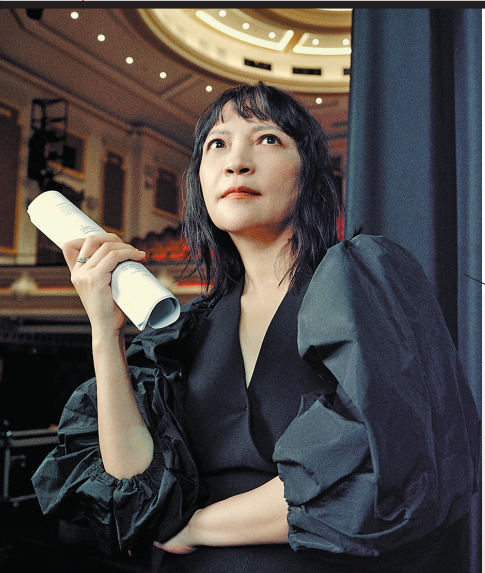
虹影，旅英华裔作家。代表作有长篇小说《饥饿的女儿》《好儿女花》等，曾获意大利“罗马文学奖”，多部小说被改编成影视作品。