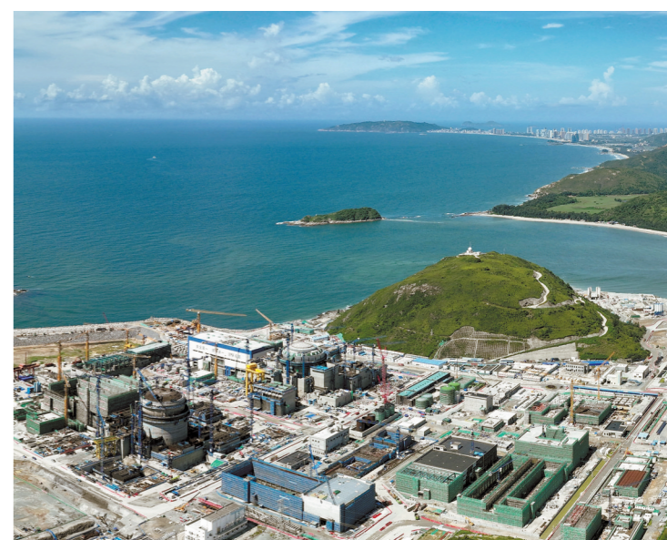
中广核广东太平岭核电项目“华龙一号”建设现场

据悉，东莞市住房和城乡建设局正在会同市自然资源局等部门深入调查研究，借鉴周边城市经验做法，立足东莞实际，强化政策协调配合，全面开展排查，建立完善台账，推动“双(多)证合一”落地实施。预计将有助释放合理住房需求，改善市场预期，促进房地产市场平稳健康发展。