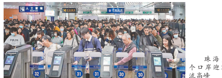
珠海多个口岸迎客流高峰

车八岭保护区于1981年建立，1988年晋升为国家级自然保护区，2007年加入联合国教科文组织世界生物圈保护区网络。保护区总面积7545公顷，位于北纬24°线上，地处亚热带常绿阔叶林集中分布区，是世界同纬度带原生性较强、面积较大的亚热带常绿阔叶林，是南亚热带向中亚热带过渡的典型代表，也是我国具有国际意义的14个陆地生物多样性关键地区之一。南岭山地地区的重要组成部分，生物多样性资源十分丰富，被誉为“物种宝库 南岭明珠”，共记录有野生高等植物2027种，其中国家重点保护植物29种；野生动物1689种(脊椎动物467种、昆虫1222种)，其中国家重点保护野生动物78种；大型真菌699种。