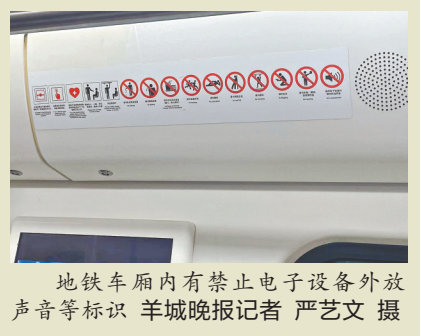
地铁车厢内有禁止电子设备外放声音等标识

新修订的《广州市城市轨道交通管理条例》(以下简称《条例》)于2024年1月1日起施行，禁止使用电子设备时外放声音等9类影响城市轨道交通公共场所容貌、环境卫生的行为。此外，《条例》明确禁止携带宠物、家禽等动物乘车，满足条件的导盲犬、扶助犬除外。