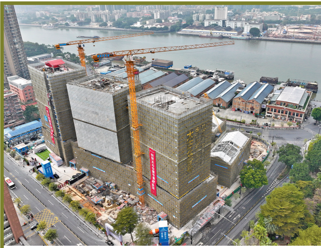
太古仓壹号项目航拍图

提高疾病预防能力，为老年人免费接种23价肺炎球菌疫苗。强化接种安全和医疗保障，全市累计为65岁及以上老年人免费接种23价肺炎疫苗27万剂，有效降低老年人肺炎疫苗可预防传染病的发病率。 方便群众就医结算，扩大就医信用无感支付“先看病后付费”试点。上线医保定点医疗机构49家，纳入医保协议银行15家，实现就医报账、缴费“零排队”“零操作”体验。