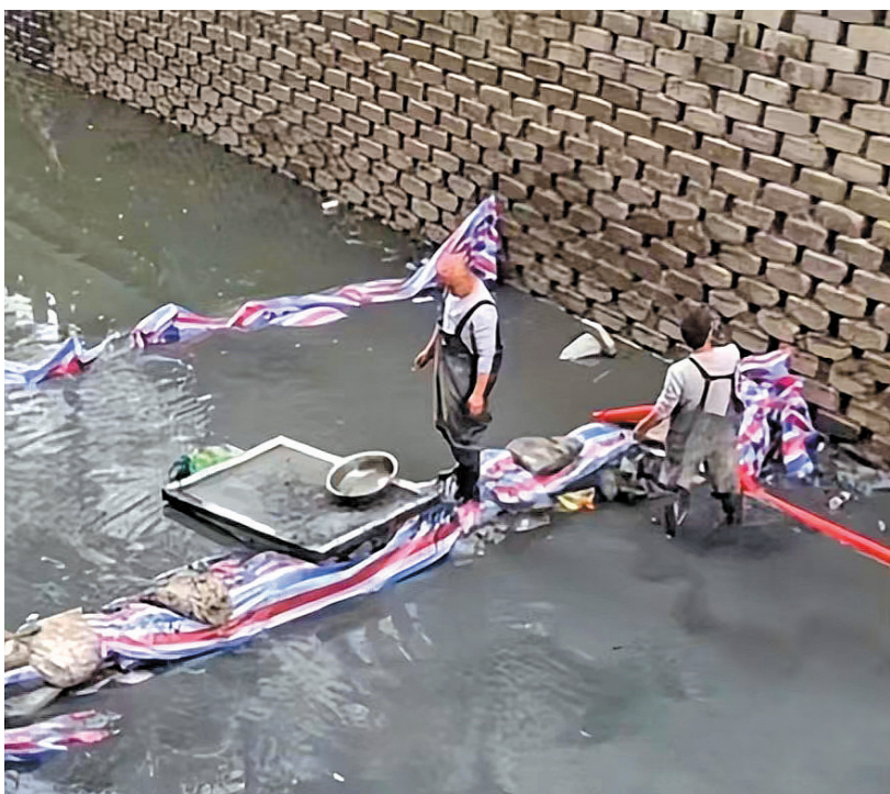
打捞团队成功找到戒指

记者了解到，事发地佛山市南海区桂城平洲玉器街是广东有名的玉器一条街，史料记载，平洲玉器的发展最早可追溯到清朝，上世纪70年代起迎来跨越式发展，如今已是全国四大翡翠集散地之一，产出全国近80%的翡翠手镯，已形成价值千亿元的珠宝玉器产业链。