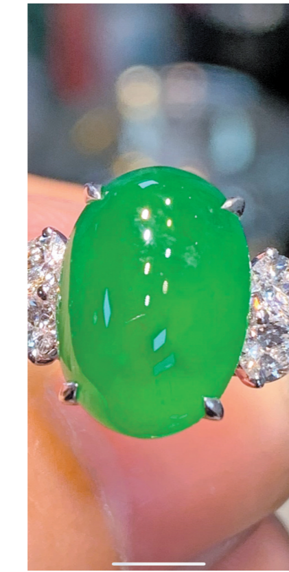
掉落前的翡翠戒指

“找到啦！”1月8日晚8时20分左右，佛山市南海区桂城街道平洲玉器街一条河涌旁，只见约5米深的一条小涌里，一名身穿胶裤背带裤的清理工右手举起一物，聚集在河涌两岸的人群忽然欢呼起来，还有人放起了烟花。一个个正在直播的手机屏幕将这一幕照得一清二楚。这是一场为期4天的打捞行动，也是一场直播了数天的网络狂欢。而事件则源于旁边大楼上一名男子的小心——该男子拿着一枚刚镶嵌好的价值不菲的翡翠戒指到窗边自然光下查看时，手一滑，戒指掉到了楼下的河涌里。