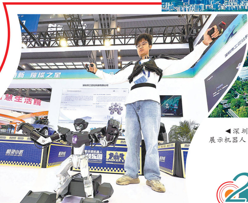
深圳高交会展示机器人