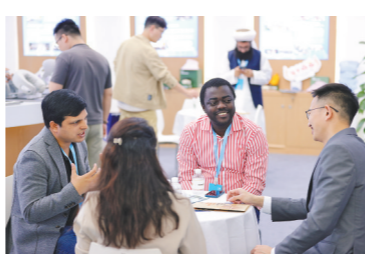
国际人才交流大会在深圳举行

这样充满安全感、人情味、科技感的城市,不仅虏获了当地居民的心,而且也吸引了八方来客。春节期间,深圳各旅游景区(点)、文化场馆、文体娱乐场所装扮一新,喜迎八方市民游客。假期深圳全市接待游客825.96万人次,实现旅游收入87.87亿元,两项数据均创历史新高。城市的引力、魅力,在这一个个场景和数据中充分彰显。