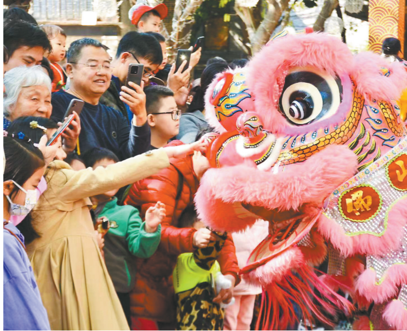
优秀传统文化焕发新活力

2023年，佛山全年实现地区生产总值1.33万亿元、增长5%，成为全省第二个、全国第四个规模以上工业总产值突破3万亿元的城市。新的一年，佛山将大力推进产业与科技融合聚变：谋求动力转换之变，用高端技术、先进装备、绿色工艺、创意设计赋能大众化产品；谋求成果转化之变，努力把佛山打造成为小试中试的天堂；谋求转型升级之变，坚持技术改造、数字化改造、村级工业园改造、全域土地综合整治改革、企业股份制改革等“五改”联动；谋求新兴产业之变，推动数控机床、工业机器人、新型储能等产业集群聚集；谋求区域协调之变，深入推进北向战略、西进计划，高水平创建城乡区域协调发展示范区；谋求以才聚产之变，大力培育引进“十类人才”，倾力打造近悦远来的人才发展环境。