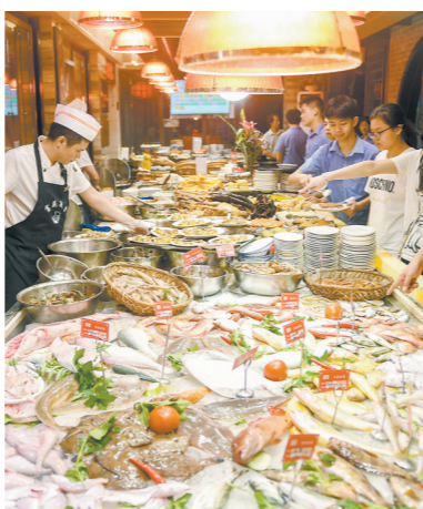
汕头作为“美食孤岛”享誉海内外，近悦远来

在推进中国式现代化建设中闯出新路来 乘势而上、大干快干 汕头将坚持“工业立市、产业强市”，以贸促工、以工兴贸、工商并举，以科技赋能加快纺织服装、玩具创意、大健康等传统产业升级，以技术突破加速新能源、新材料、新一代电子信息等新兴产业“弯道超车”，建设全球最大的六自由度风电机组加载实验平台等科研重器，打造汕头科学城、南澳科学会议等创新平台，提速发力“百千万工程”，办好国际潮团、潮商“两大盛会”，当好汕潮揭都市圈一体化发展“火车头”，乘势而上、大干快干，在推进中国式现代化建设中闯出新路来。