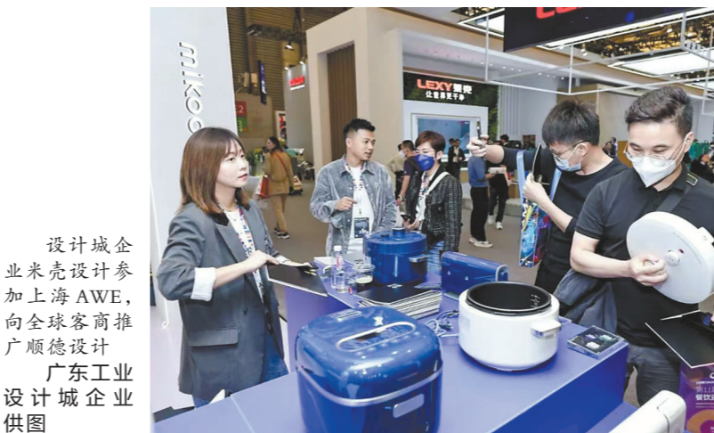
设计城企业米壳设计参加上海AWE，向全球客商推广顺德设计