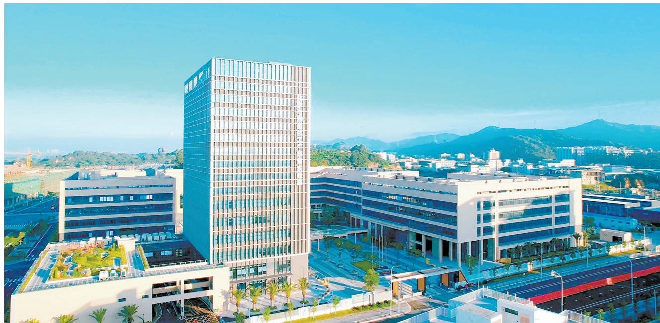
打造科创高地，汕头这座“科学之城”正冉冉升起 汕宣供图