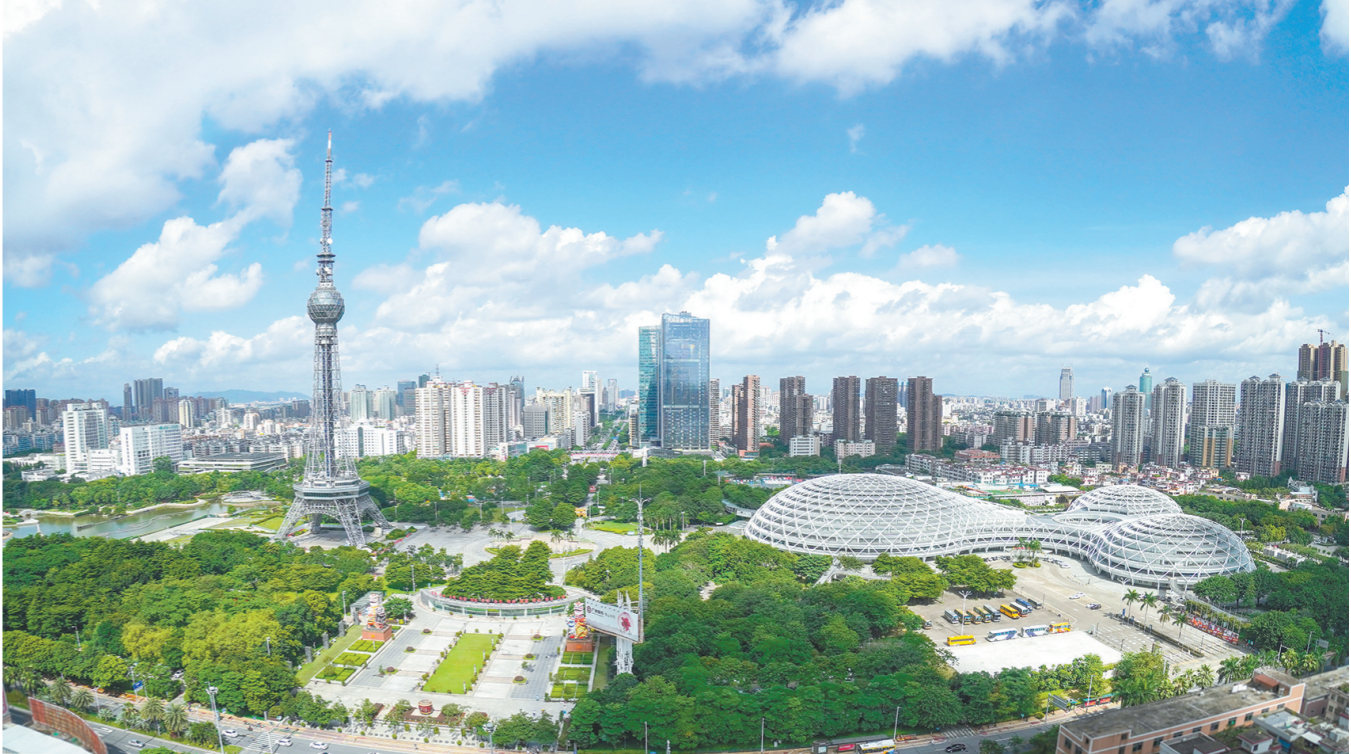
佛山不断推进“绿美佛山”生态建设，城市面貌美丽蝶变