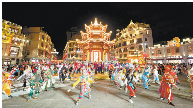
汕头小公园是海内外潮人共同的精神家园