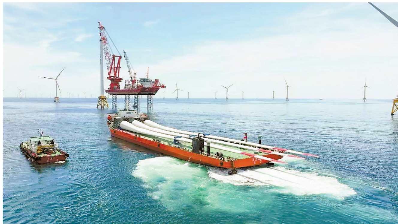
乘“风”而起，汕头积极向海图强、向海兴

商圈街巷人声鼎沸、热气升腾；产业园区机器轰鸣、车辆穿梭；港区码头货轮畅行、通江达海……甲辰龙年伊始，伴随着高质量发展的鼓点，南海之滨的汕头，延续着春节长假期间的“热辣滚烫”，全市多个行业乘着浩荡春风，实干快干不停歇，到处都是穿梭奔忙、播种希望的新景象。 从“百载商埠”楼船万国到“网红城市”近悦远来，从获批设立首批经济特区到如今建设省域副中心城市，汕头迎来了续写百载商埠新辉煌、争当粤东粤西粤北地区发展领跑者的历史机遇。 如何抢抓机遇，实现“迎头赶上”呢？汕头提出将坚持“工业立市、产业强市”发展思路，以贸促工、以工兴贸、工商并举，进一步激活经济特区活力，建设幸福家园，加快打造重要发展极，把省域副中心城市做实做强，努力在推进中国式现代化建设中焕发新气象、闯出新路来。