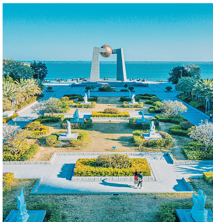
南澳是汕头引客来留客心的文旅名片