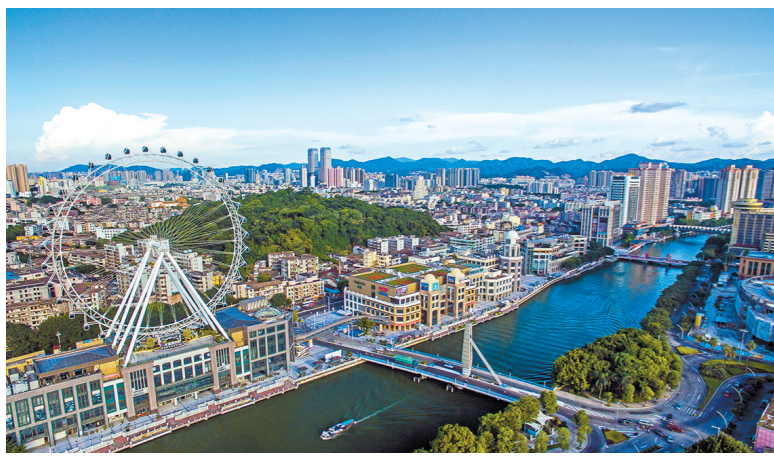
中山市岐江河两岸城市风景