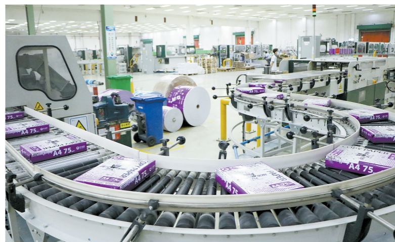
江门坚持以实体经济为本、制造业当家