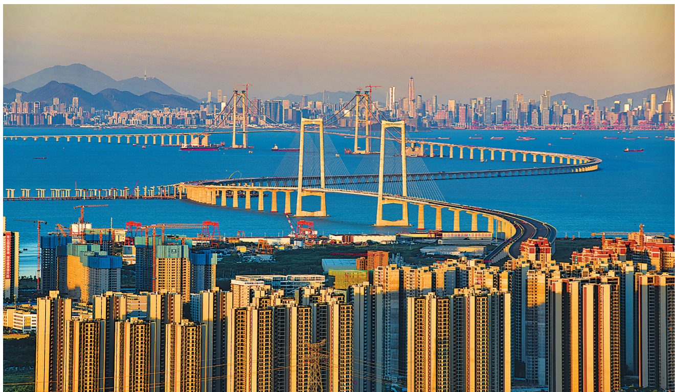
从中山远眺在建中的深中通道及珠江口东岸的深圳市

2024年,中山将抢抓深中通道通车新机遇,以改革开放创新思维推动珠江口东西两岸产业科技融合发展,更加主动地引流产业科技要素汇集中山、服务中山;坚定扛起广东省珠江口东西两岸融合发展改革创新实验区建设责任,推动深中规划、营商环境、产业、交通、创新、公共服务和社会治理“六个一体化”;全力营造“无创新、不中山”的崇尚创新的社会氛围,以科技创新引领产业振兴,推动产业与科技互促双强,进一步擦亮“制造中山”的城市名片;将“百千万工程”作为推动高质量发展的头号工程、总抓手,把中山建设得更加美丽,营造吸引人才、留住人才的良好环境。