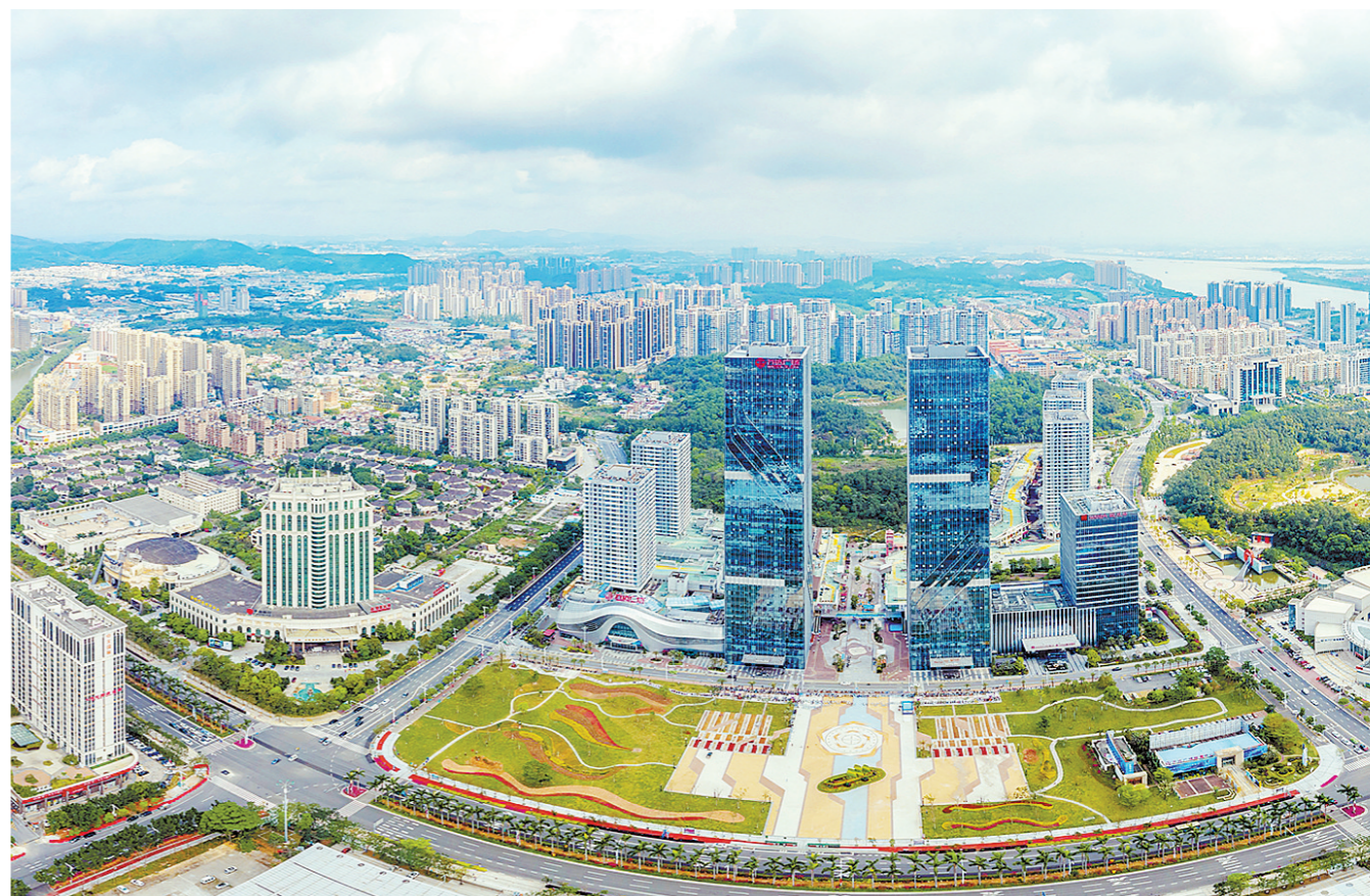
江门中心城区鸟瞰

高质量发展是新时代的硬道理。过去一年,在广东省委、省政府领导下,在兄弟城市的帮助下,江门加快省大型产业集聚区建设,工业投资完成1000亿元,GDP突破4000亿元,高质量发展迈上新台阶。2024年,江门将乘势而为,落实好大湾区发展规划纲要,抓住深中通道、黄茅海大桥通车重大机遇,发挥区位优势、产业、土地、水源、能源比较优势,加快与深圳、香港共建现代产业合作区,建设港澳居民、华侨华人发展新平台,加快中微子、碳中和实验室建设,加快发展农业食品、先进材料、电子信息等六大千亿产业,加快发展新能源、低空经济等十个新兴产业,确保GDP增长5.5%以上,为广东高质量发展贡献江门力量。