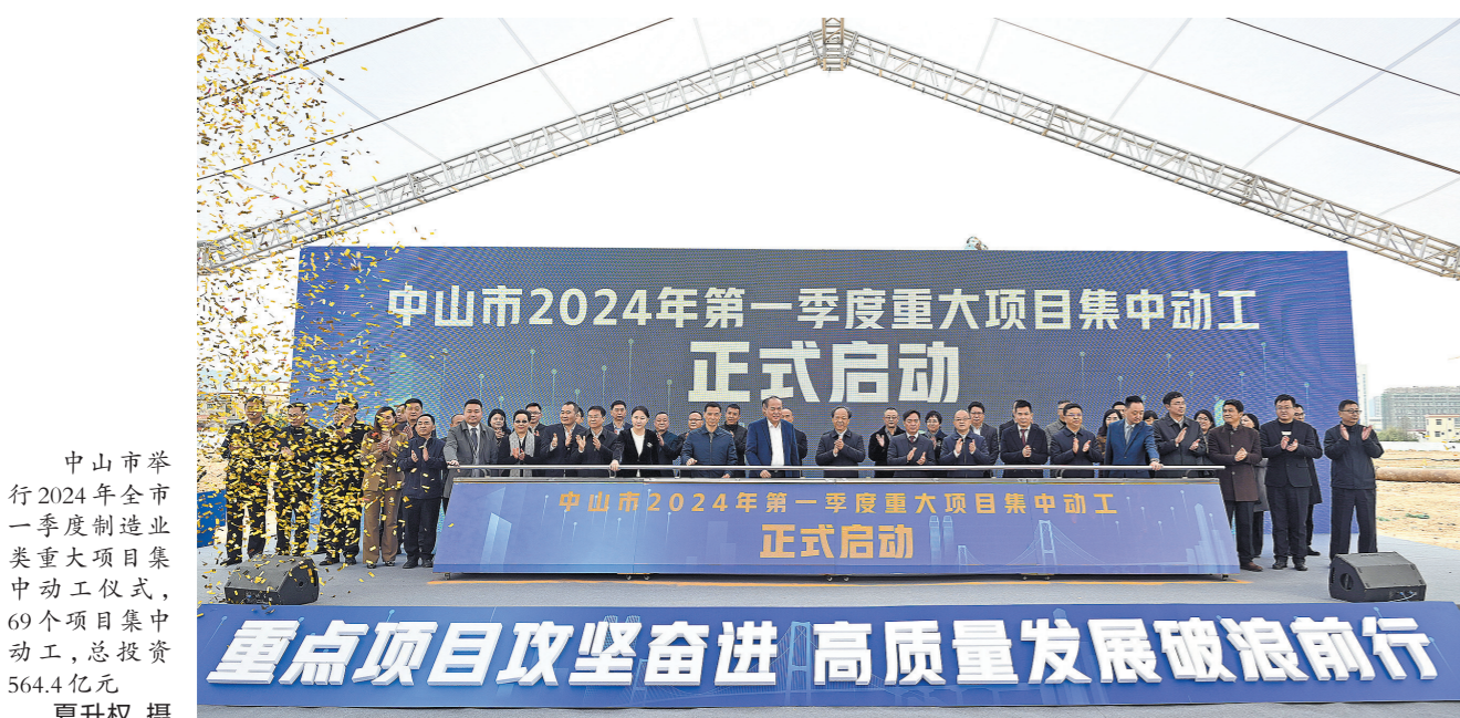
中山市举行2024年一季度制造业类重大项目集中动工仪式,69个项目集中动工,总投资564.4亿元