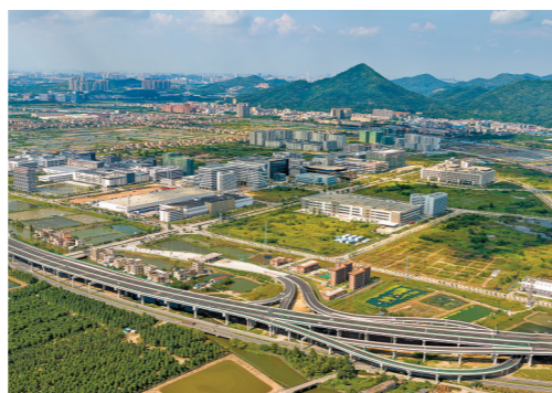
广东板芙经济开发区航拍

中山紧紧把握深中通道即将开通新机遇,坚决落实好省委部署,以深中“六个一体化”推动深圳香港等科创+中山制造。制定实施“科创强市15条”,集中力量扶持重点企业、投入50亿元推动传统制造业技改,加快培育壮大新能源、生物医药等战略性新兴产业,打造湾区光谷。深入实施“百千万工程”,坚定不移攻坚低效工业园改造,力抓工业投资,支撑制造业当家、高质量发展。开局即决战,中山将以更大的信心决心,政企同心拼经济,脚踏实地加油干!开新局!