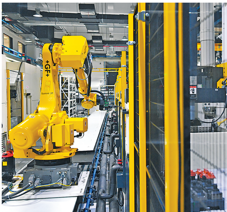
中山坚持以科技创新引领产业振兴