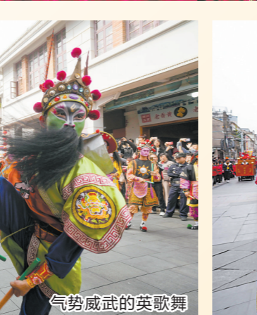
气势威武的英歌舞