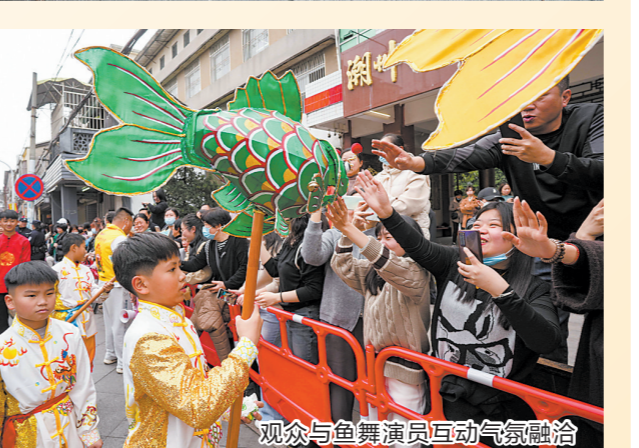
观众与鱼舞演员互动气氛融洽