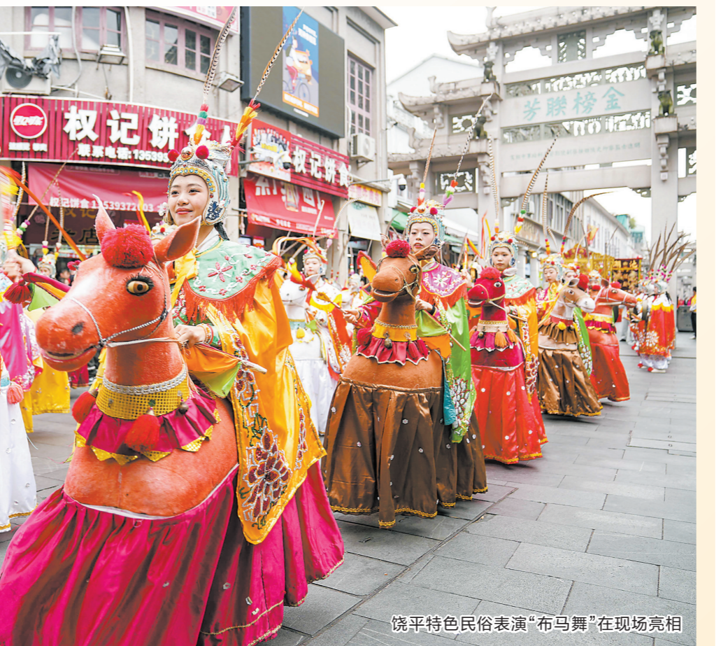
饶平特色民俗表演“布马舞”在现场亮相

据悉,潮州青龙庙会已成为集潮州民俗传统文化、凝聚世界潮人潮心、促进文化经济交流等作用于一身的非物质文化遗产保护项目。每年青龙庙会期间,远在海内外的潮人纷纷回乡,与家乡人民共襄盛举、祝福国泰民安。