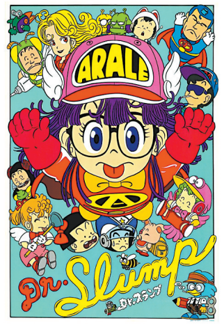
鸟山明成名作《阿拉蕾》

1980年，鸟山明的首部长篇漫画《阿拉蕾》在集英社旗下的《周刊少年JUMP》连载并大获成功，让他从一个名古屋出生的穷小子一跃成为日本最畅销的漫画家之一。不过长达四年的连载让他身心俱疲，他在1984年完结了《阿拉蕾》，开始短暂的休假——但代价是三个月内要开始新作连载。