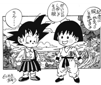
鸟山明曾让悟空和小丸子同框