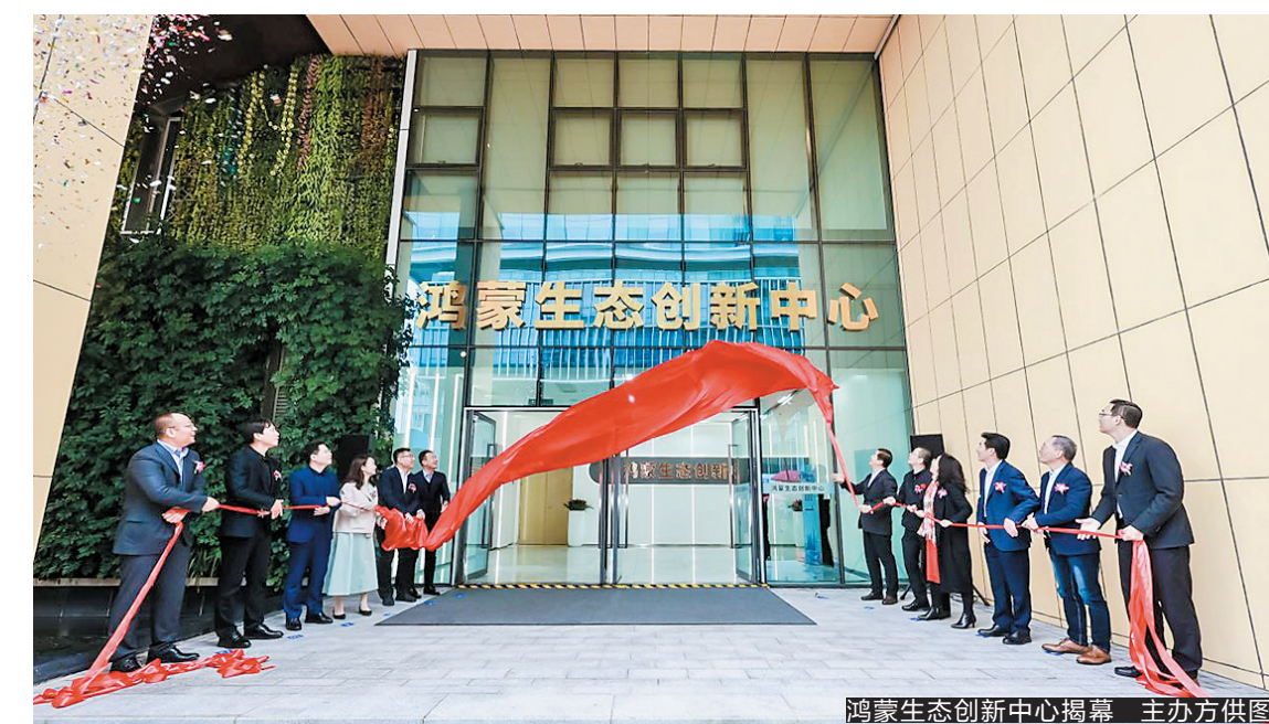
鸿蒙生态创新中心揭幕

推动高质量发展、培育壮大新质生产力，鸿蒙生态发展在深发展再迎利好——3月19日，在深圳南山区深圳湾科技生态园举行的鸿蒙生态创新中心揭幕仪式上，深圳南山区正式发布《2024年南山区支持鸿蒙原生应用发展首批政策措施清单》(以下简称《清单》)，措施中有支持原生应用软件开发创新的“真金白银”，更着力推动人才、企业、科研机构和政府公共服务等领域的供需对接，全面支持鸿蒙原生应用的研发与推广，加速推动鸿蒙系统在深圳南山区乃至全国的落地与应用。